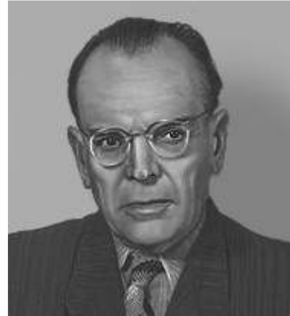
Паустовский Константин Георгиевич