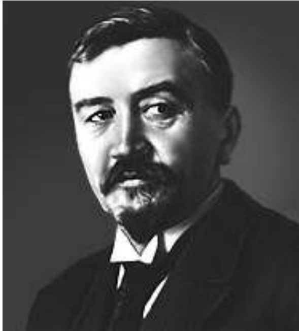
Куприн Александр Иванович