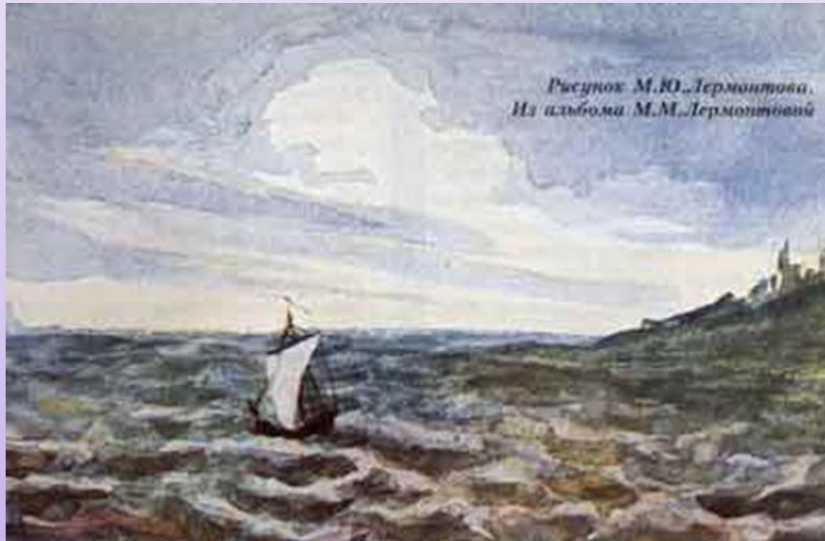
Рисунок М.Ю. Лермонтова. Из альбома М.М. Лермонтовой