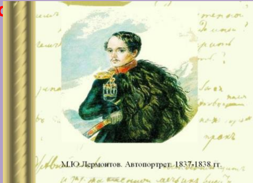
М.Ю.Лермонтов. Автопортрет. 1837-1838 гг.