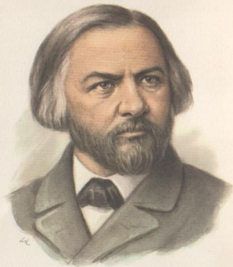
МИХАИЛ ИВАНОВИЧ ГЛИНКА