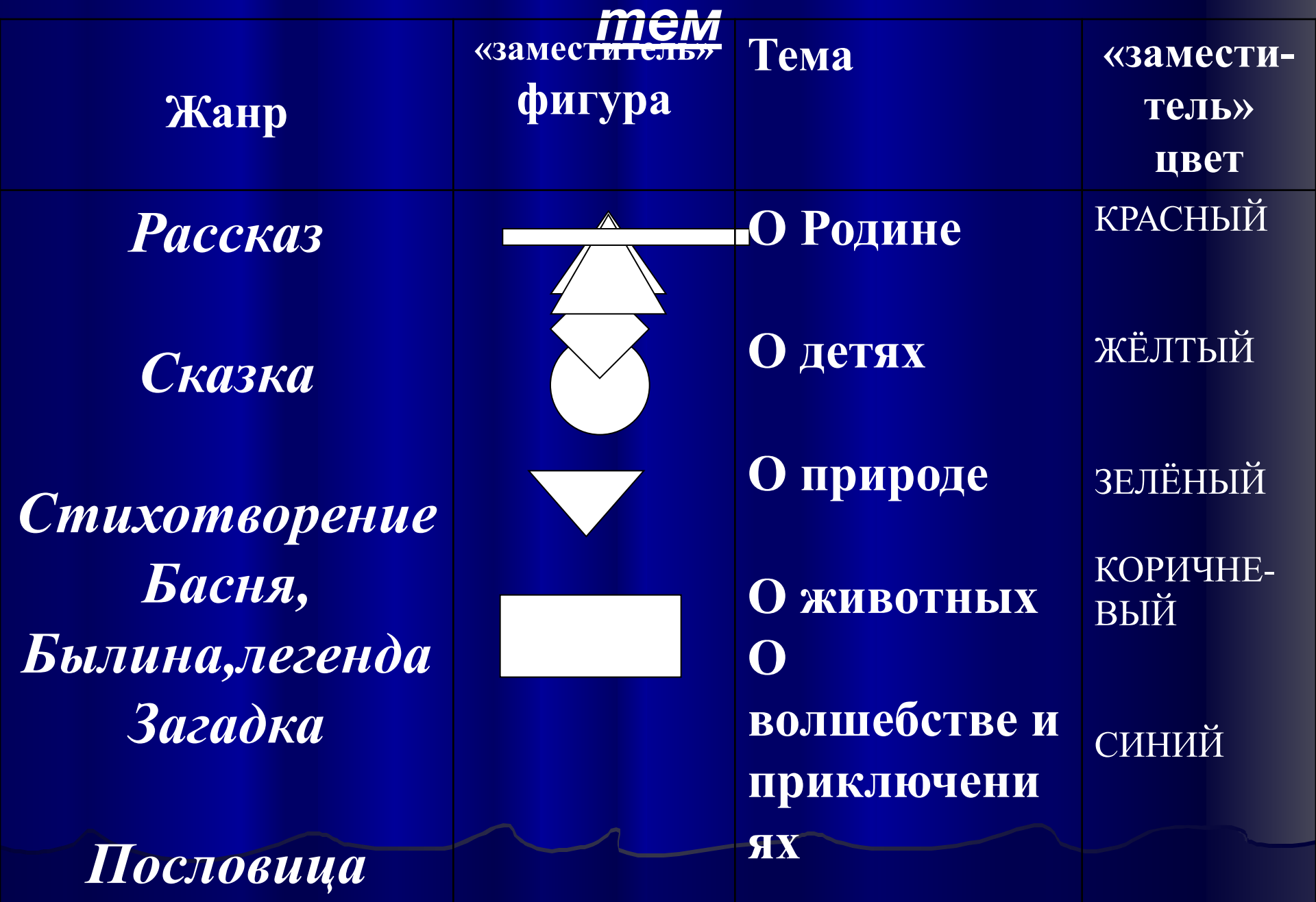
Таблица «заместителей» жанров и