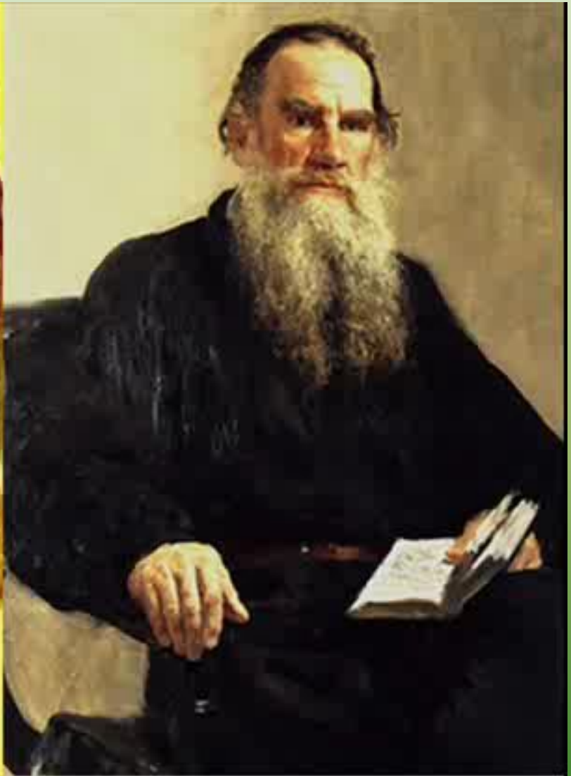
Лев Николаевич Толстой