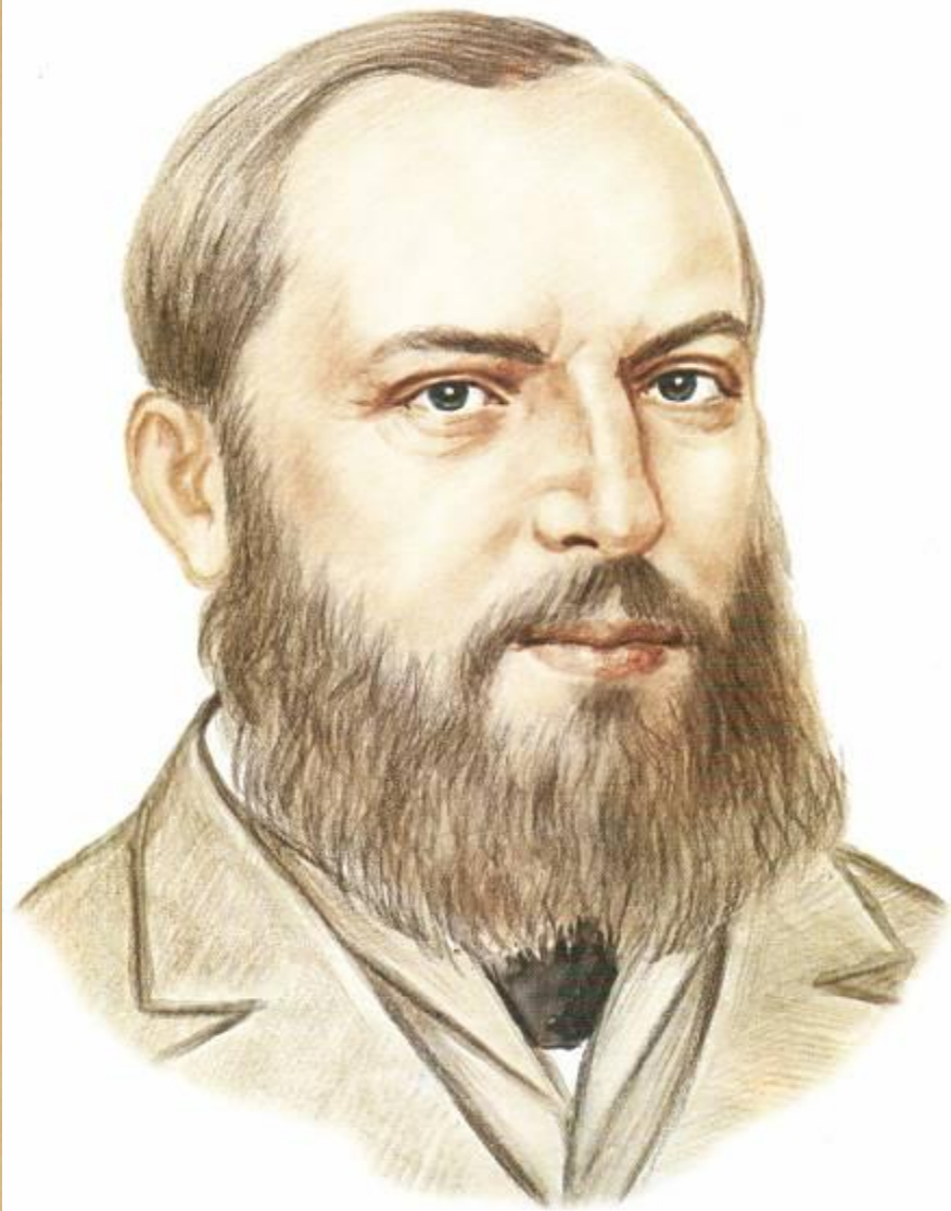
Фет Афанасий Афанасьевич (1820-1892)