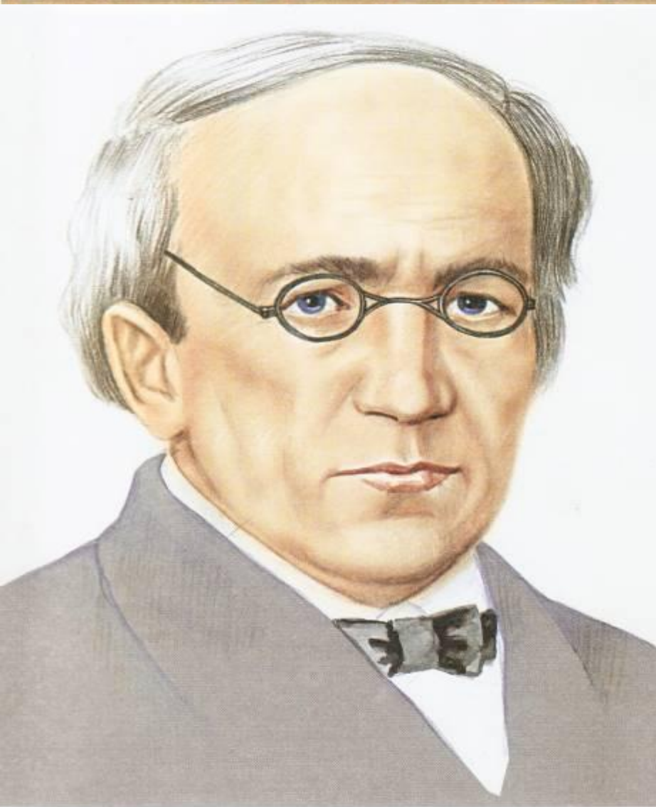
Тютчев Федор Иванович (1803-1873)