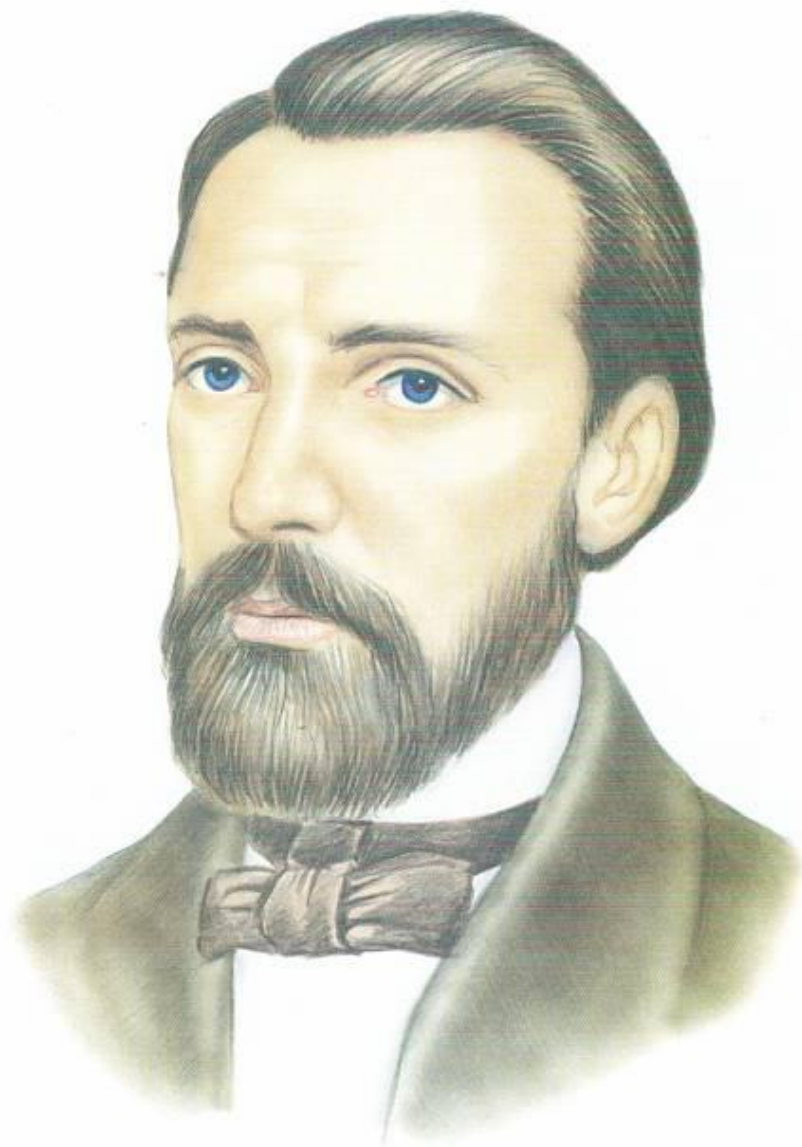
Никитин Иван Саввич (1824-1861)