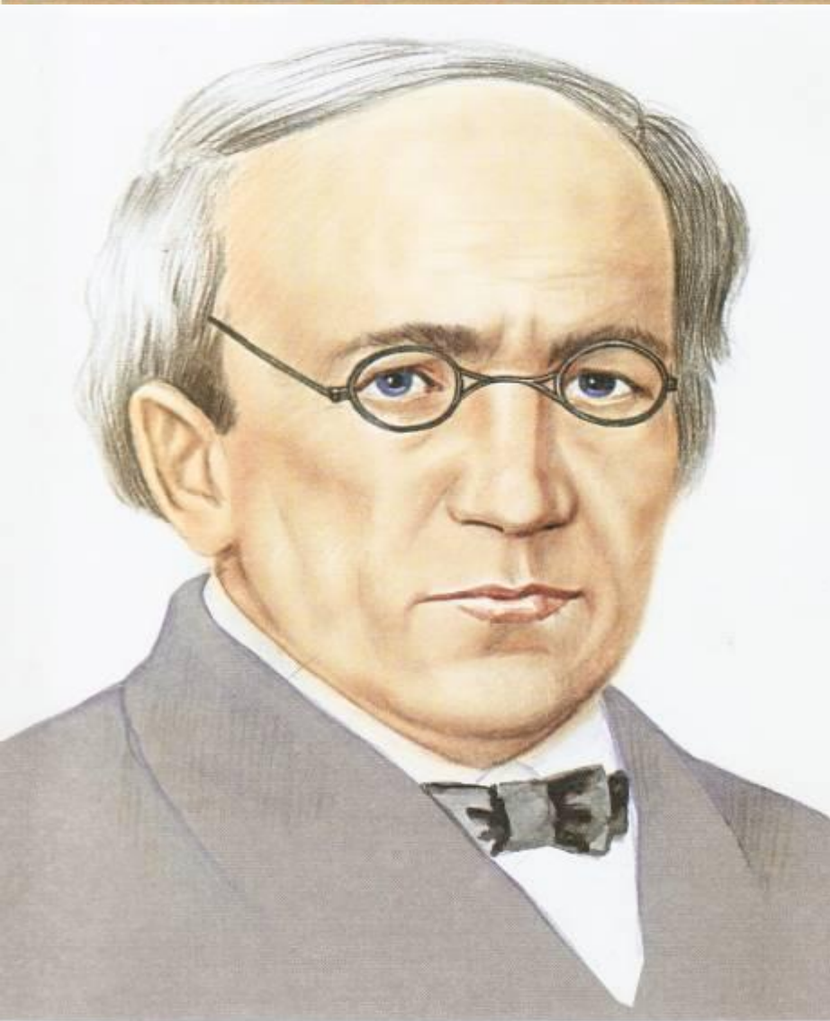
Тютчев Федор Иванович (1803-1873)