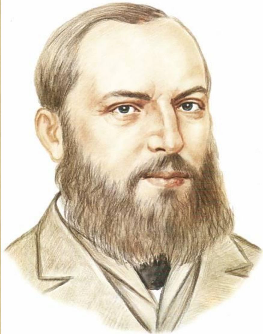
Фет Афанасий Афанасьевич (1820-1892)