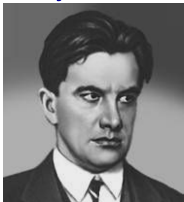
В. В. Маяковский

«Человек для нас ценен не тем, что он переживает, а тем что он делает»