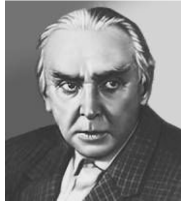
К. А. Федин