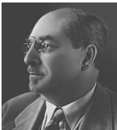
А. В. Луначарский