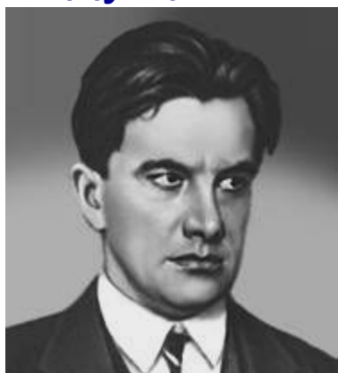
В. В. Маяковский

«Человек для нас ценен не тем, что он переживает, а тем что он делает»