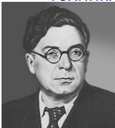
И. Л. Сельвинский

«...Лефы первые начали индустриальное обновление всяческого реквизита искусства, пытаюсь связать проблемы искусства с задачами промышленной техники и быта Советской России»