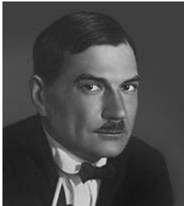
Е. И. Замятин