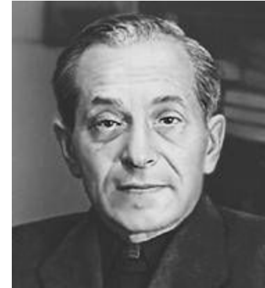
М. М. Зощенко