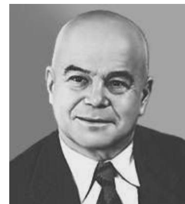
В. Б. Шкловский