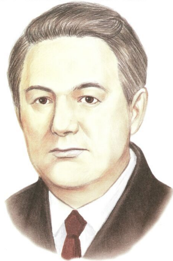
Сладков Николай Иванович (1920-1996)