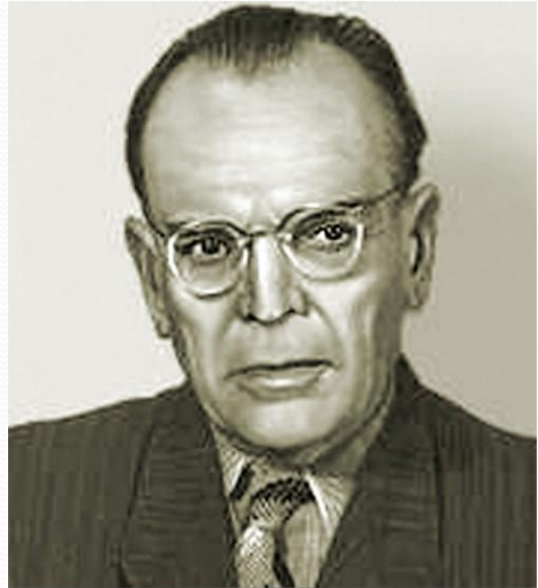
Константин Паустовский helpster.ru