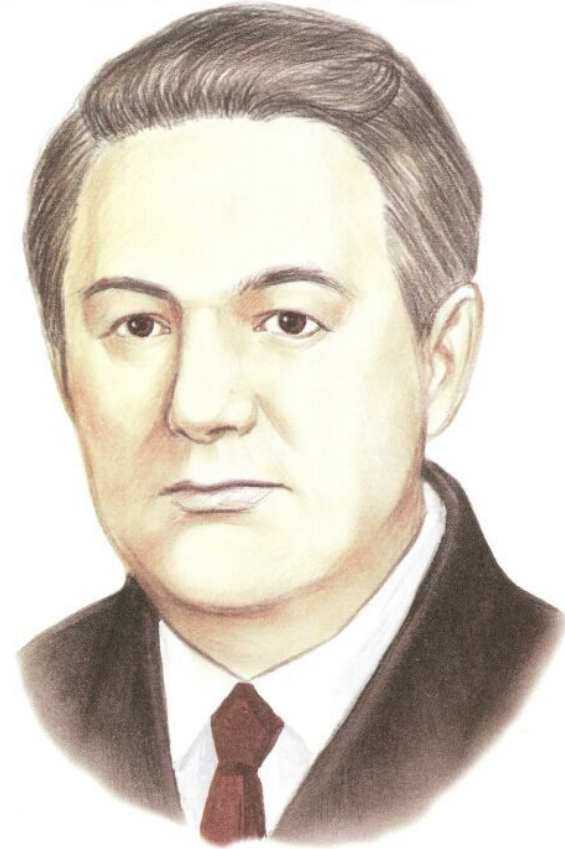
Сладков Николай Иванович (1920-1996)