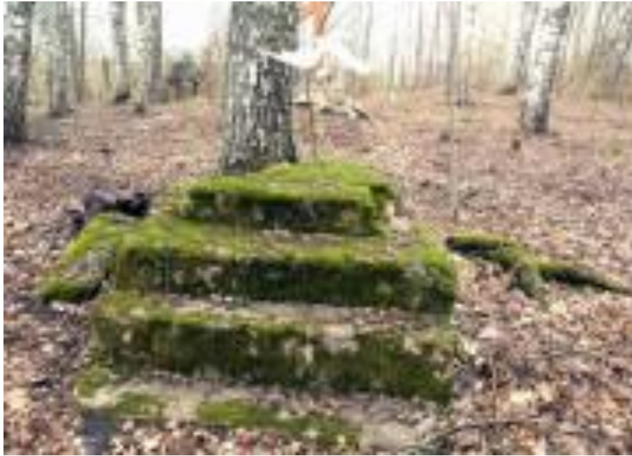
Фундамент церкви в Прихабах