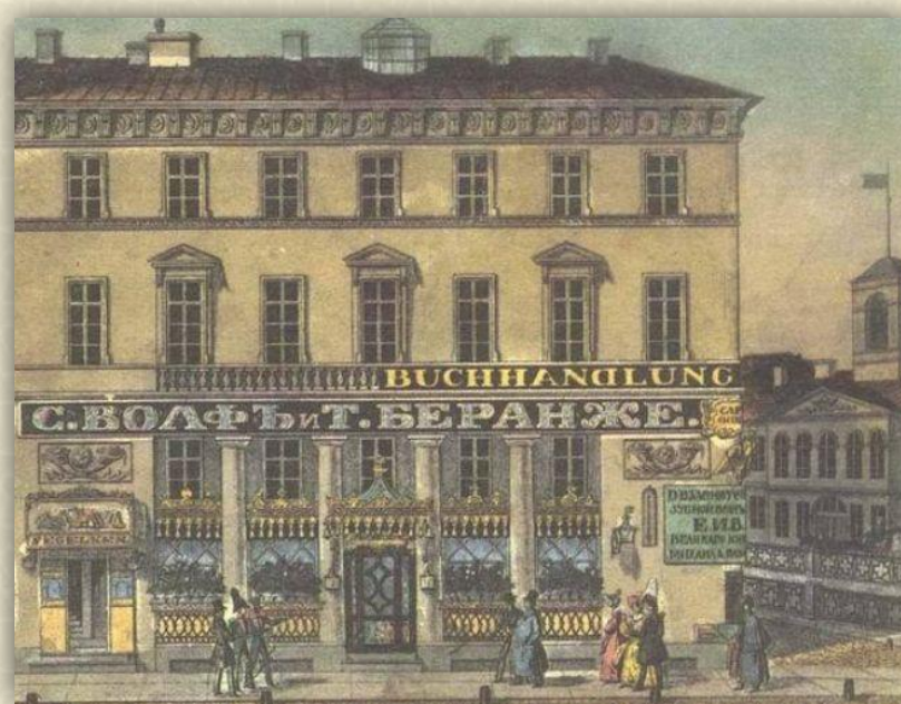
Кондитерская Вольфа и Беранже.