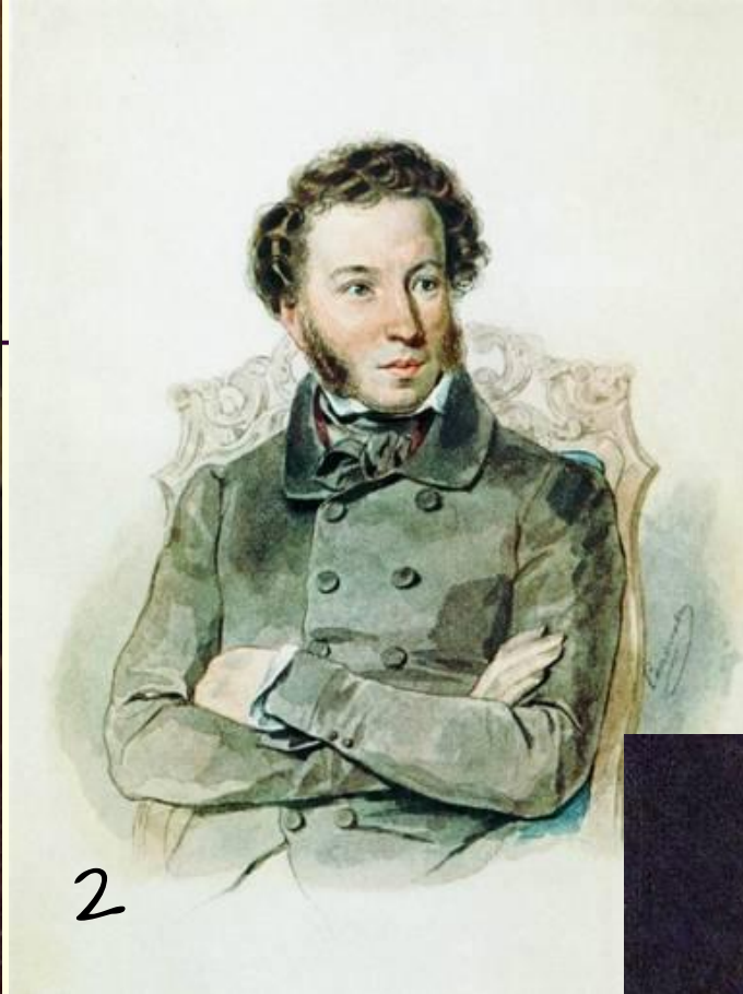
П.Ф.Соколов Портрет А.С. Пушкина