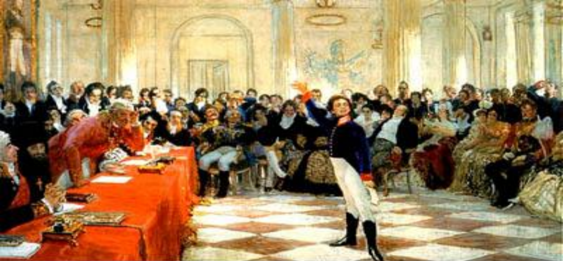
Илья Репин. А. С. Пушкин читает свою поэму перед Гавриилом Державиным на лицейском экзамене в Царском Селе 8 января 1815 года. Царскосельский Лицей (Всероссийский музей А. С. Пушкина)

Как называлось стихотворение, прочитанное Пушкиным на экзамене?