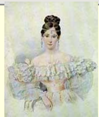
С портрета В. Жау