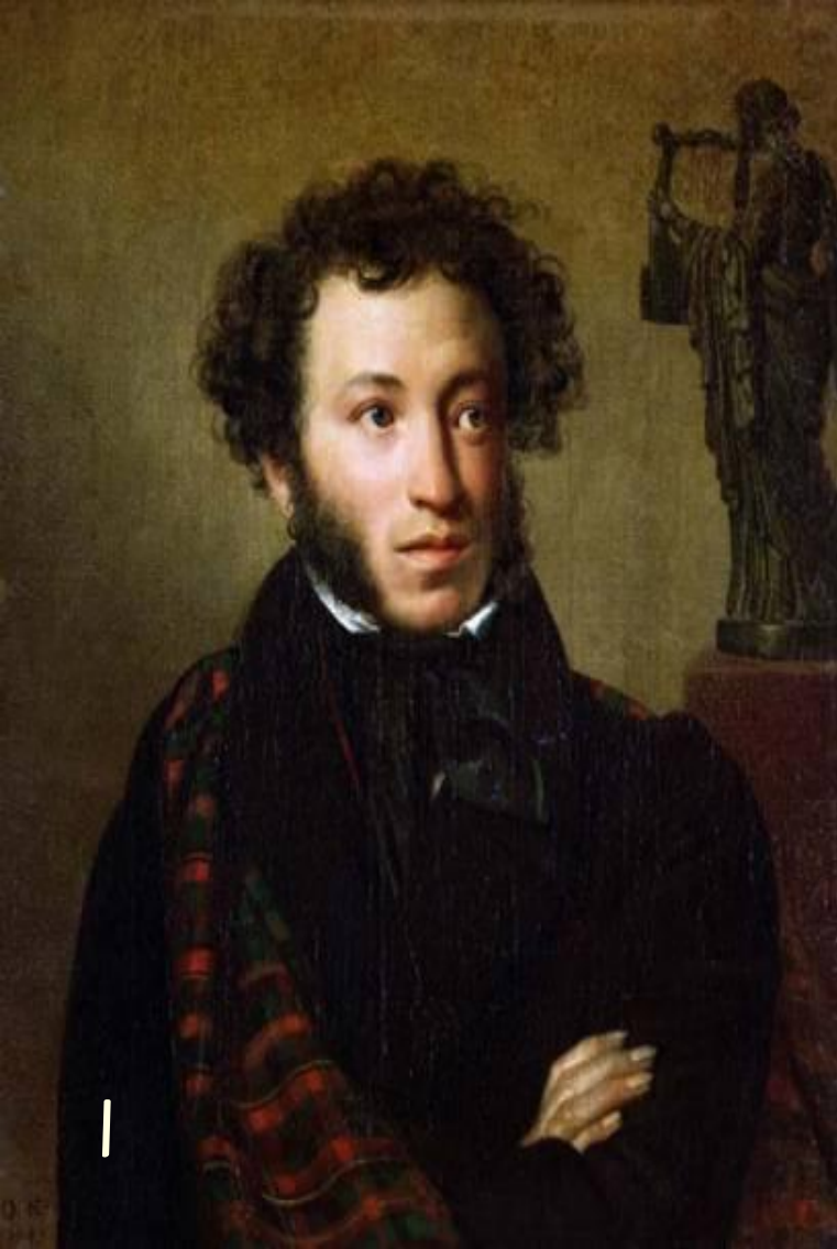
О.А.Кипренский. Портрет А.С.Пушкина