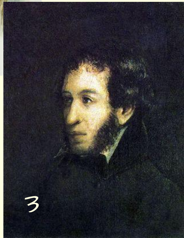
И.Л.Ливнёв Портрет А.С.Пушкина