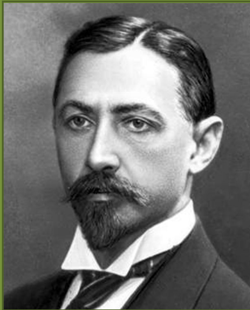
Иван Александрович БУНИН

«Литература», №06/2011 ИД "Первое сентября"