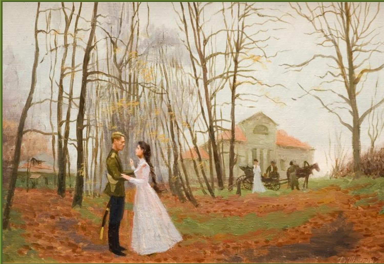
Прощание. Осень 1914 г.