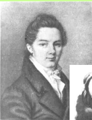
Пущин Иван Иванович Рисунок, пастель Ф. Верне 1817