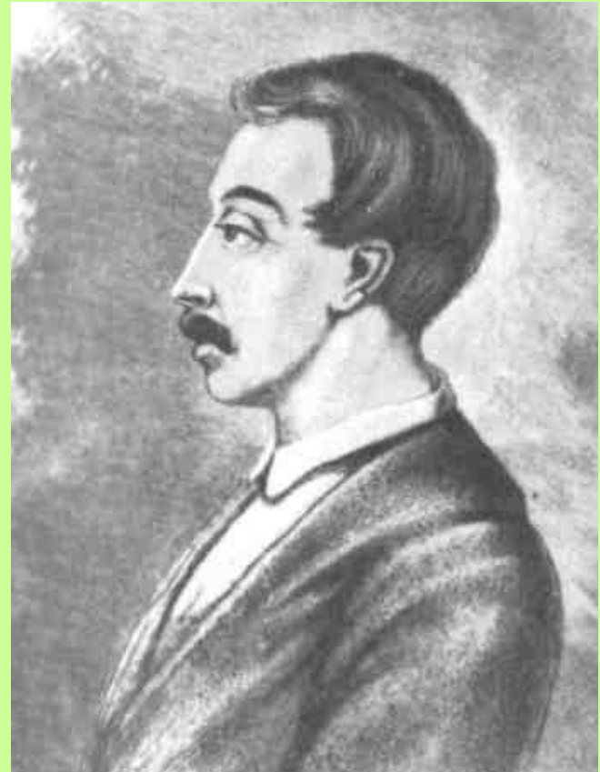
В. К. КЮХЕЛЬБЕКЕР. Гравюра И. И. Матюшина С акварели П. Л. Яковлева. 1820-е годы.

Гениальность Пушкина Кюхельбекер признал одним из первых. Когда вышла в свет пушкинская «Полтава», прохладно встреченная критикой, Кюхельбекер оценил её восторженно. Из далёкой сибирской крепости он «с okazji» писал Пушкину: «Я тебя не только люблю, как всегда любил, но за твою «Полтаву» уважаю, сколько только можно уважать. Вокруг тебя люди, понимающие тебя, как я – язык китайский»