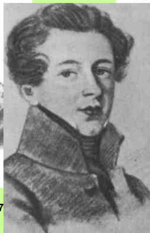
А. М. ГОРЧАКОВ. Рисунок неизвестного художника.