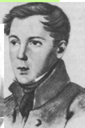
Ф. Ф. МАТЮШКИН. Рисунок неизвестного художника. 1816—1817.