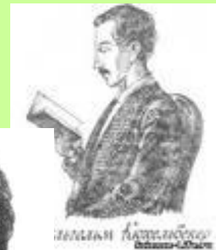
Вильгельм Карлович Кюхельбекер Акварель П. Л. Яковлева 1820-е годы