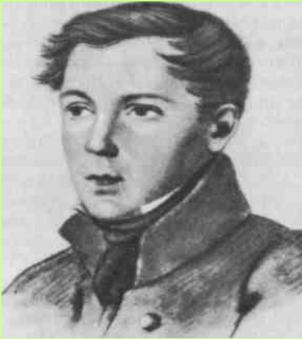
Ф. Ф. МАТЮШКИН. Рисунок неизвестного художника. 1816—1817.

Сидишь ли ты в кругу своих друзей Чужих небес любовник беспокойный? Иль снова ты проходишь тропик знойный И вечный лёд полунощных морей? Счастливый путь!.. С лицейского порога Ты на корабль перешагнул шутя, И с той поры в морях твоя дорога, О, волн и бурь любимое дитя!