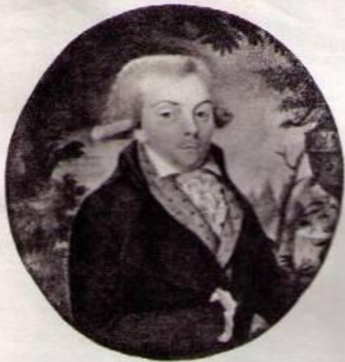
ИЛЬЯ АНДРЕЕВИЧ, дядя Л. Н. Толстого.

Миниатюра со шкатулки, принадлежавшей семье Толстых. Начало XIX века.