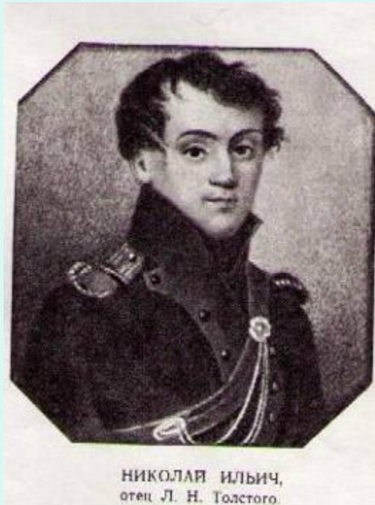
НИКОЛАЙ ИЛЬИЧ, отец Л. Н. Толстого.

По своему происхождению Лев Николаевич принадлежал к знаменитым дворянским фамилиям Толстых (со стороны отца) и Волконских (со стороны матери), давших целый ряд государственных и военных деятелей, известных в истории России.