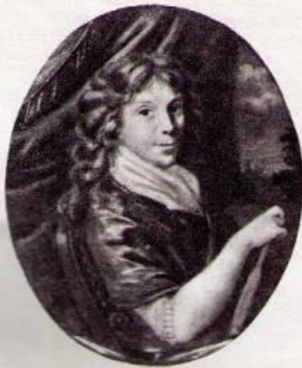
ПЕЛАГИЯ НИКОЛАЕВНА, бабушка Л. Н. Толстого.

Миниатюра со шкатулки, принадлежавшей семье Толстых. Начало XIX века.