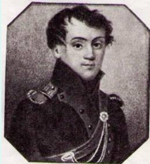
НИКОЛАЙ ИЛЬИЧ, отец Л. Н. Толстого.

По своему происхождению Лев Николаевич принадлежал к знаменитым дворянским фамилиям Толстых (со стороны отца) и Волконских (со стороны матери), давших целый ряд государственных и военных деятелей, известных в истории России.