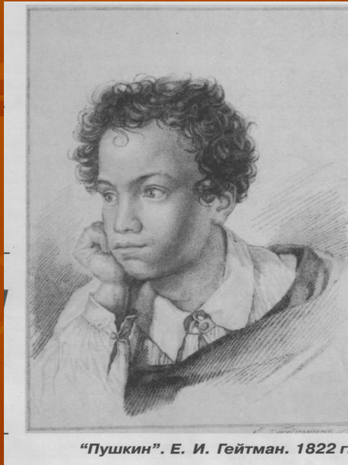
“Пушкин”. Е. И. Гейтман. 1822 г.

« Как годы учёбы в Лицее повлияли на становление Пушкина-человека и поэта? »