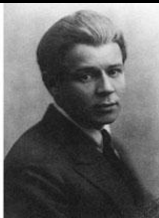
Сергей Есенин. 1925