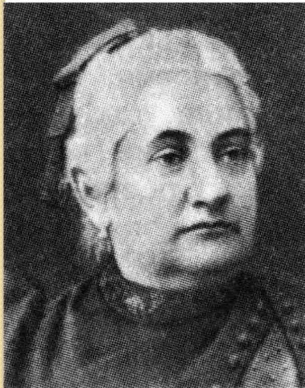
Алчевская Христина Даниловна

Семнадцатилетней девушкой она начала свой трудовой путь в воскресной школе под руководством таких крупных педагогов, как Х.Д. Алчевская и А.М. Калмыкова. В течение 3-х лет (1888–1890) она преподавала в этой школе, руководила внеклассным чтением трёх групп, рецензировала книги.