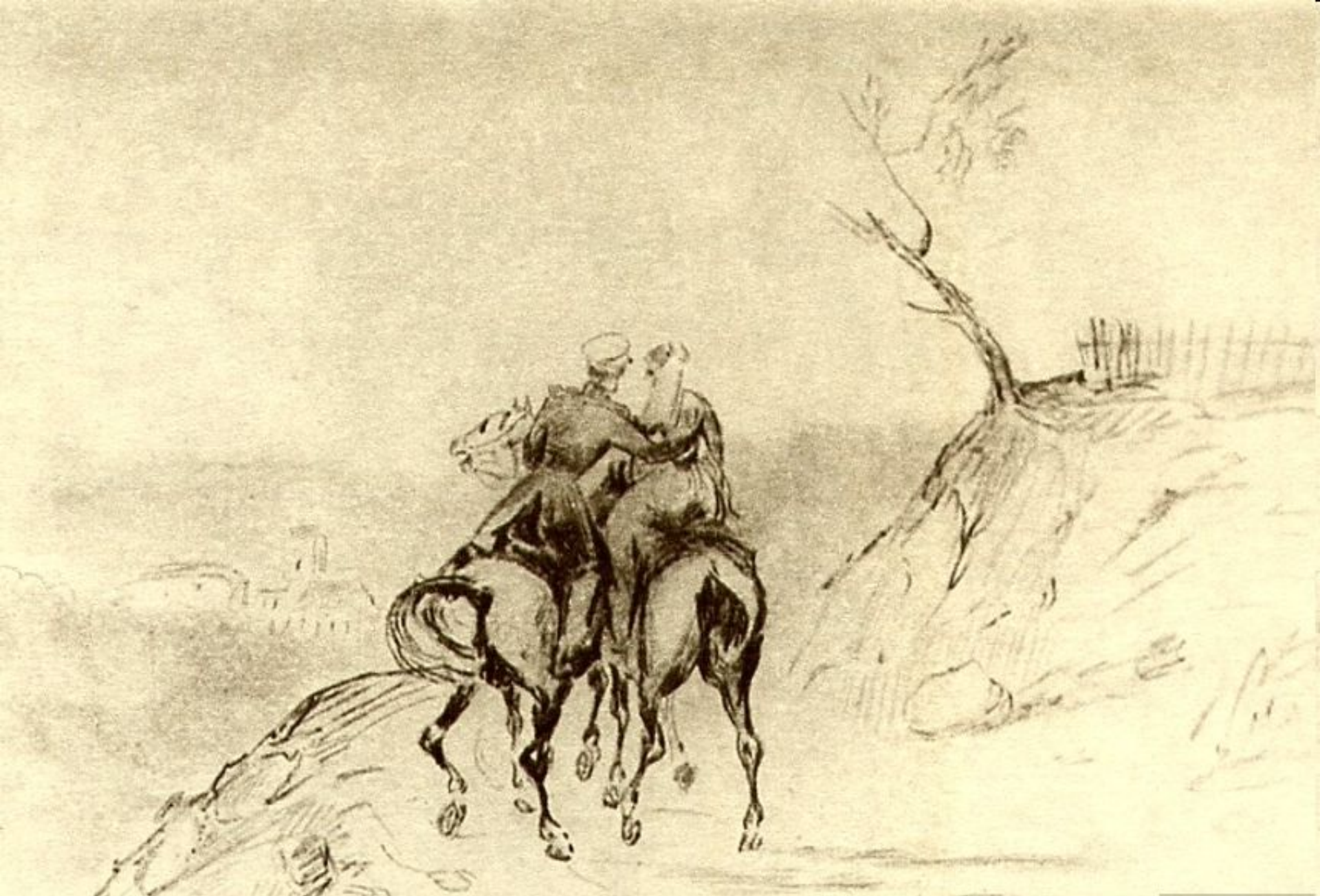
«Герой нашего времени». Печорин и княжна Мери (?) Рисунок М.Ю. Лермонтова. 1840–1841