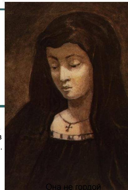
Она не гордой

Счастье, ревность, ошибки, заблуждения – всё в прошлом. В настоящем – только любовь и вина