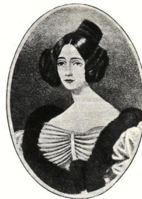
Графиня Е.П. Ростопчина