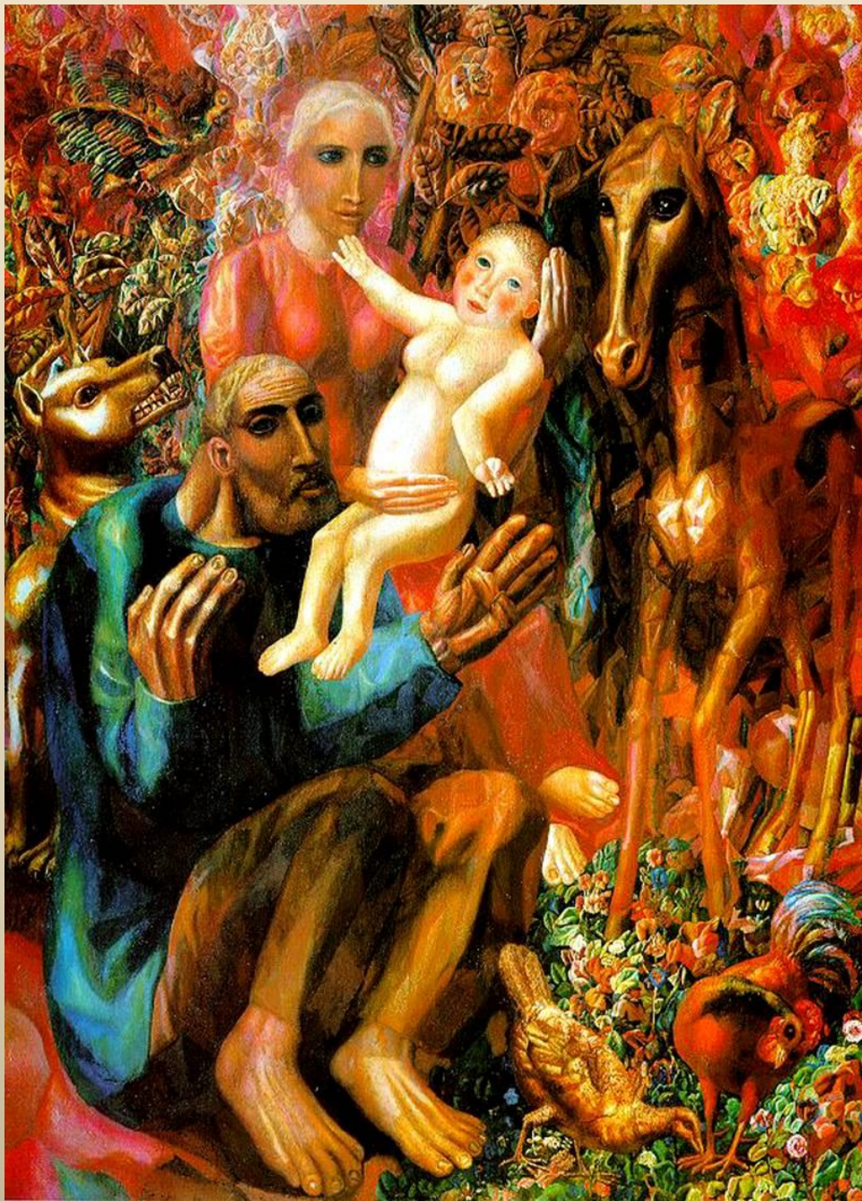
П.Филонов «Святое семейство»