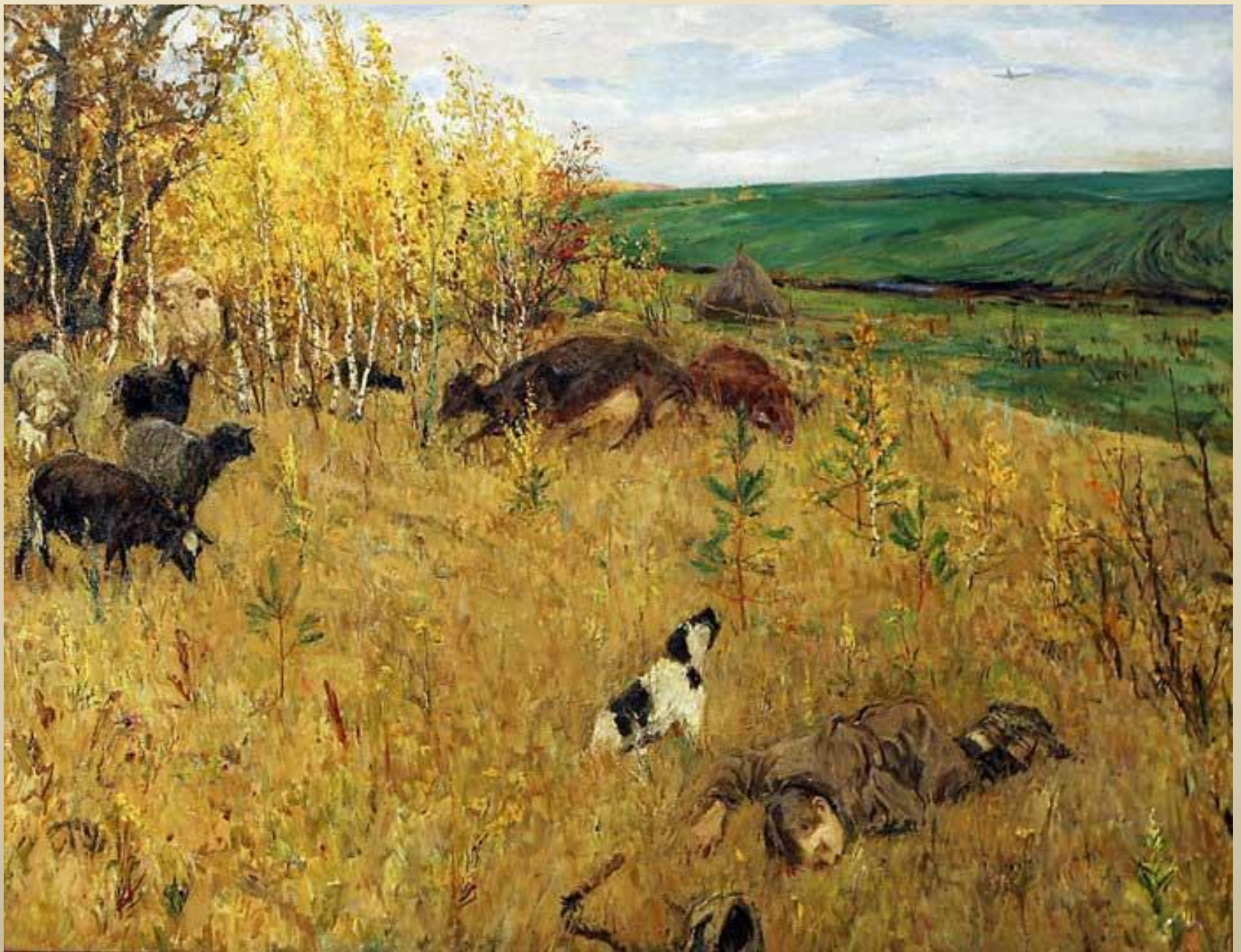
▶ А.Пластов «Фашист пролетел»