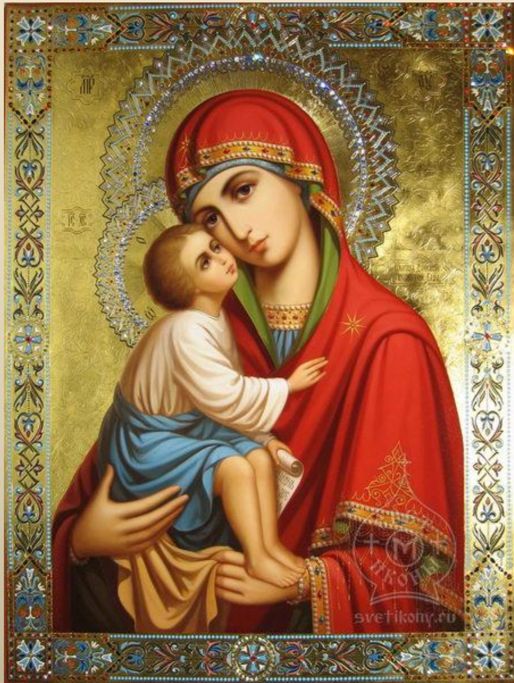
Икона Божьей Матери «Умиление»