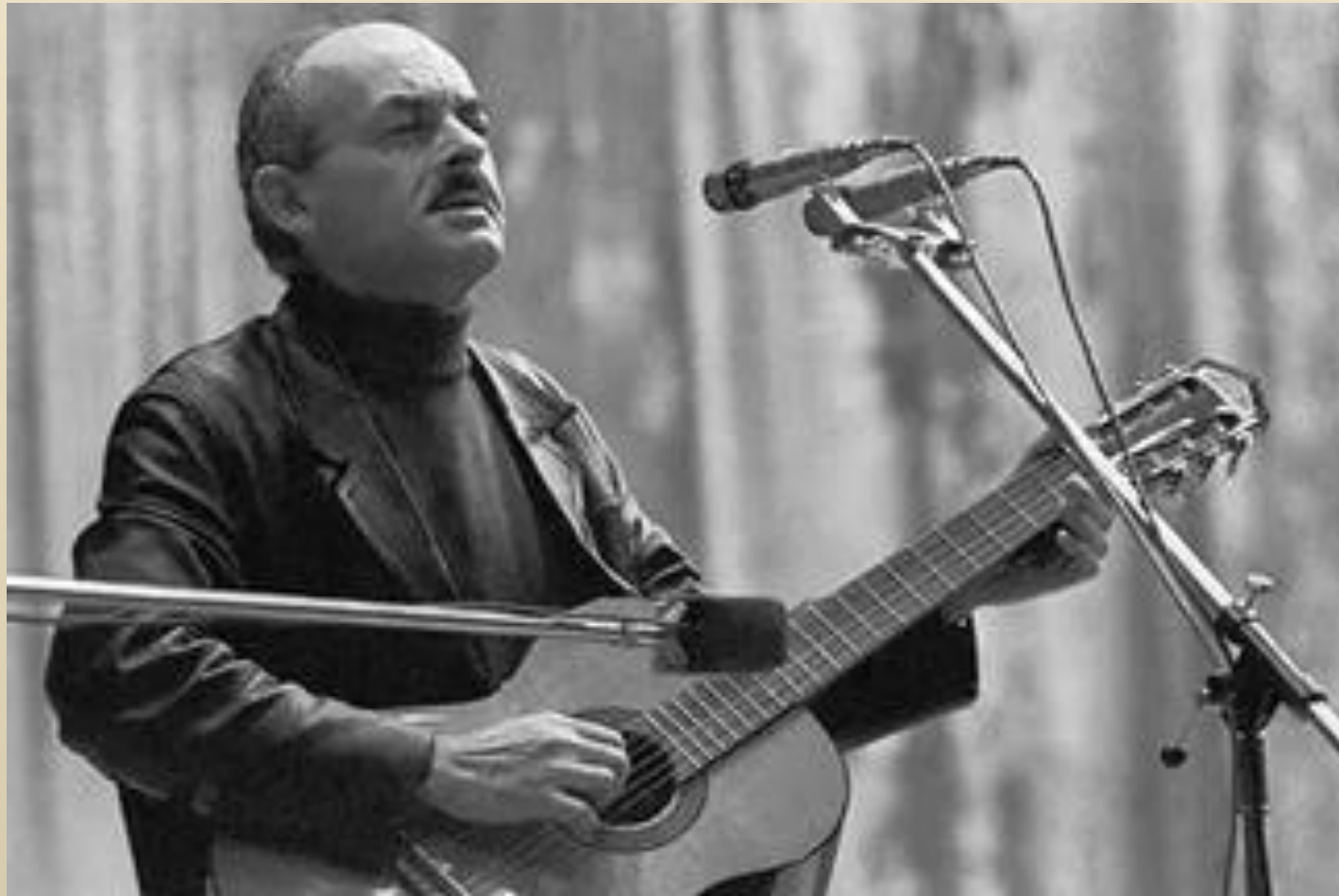
Булат Окуджава (1924- 1997г. г)