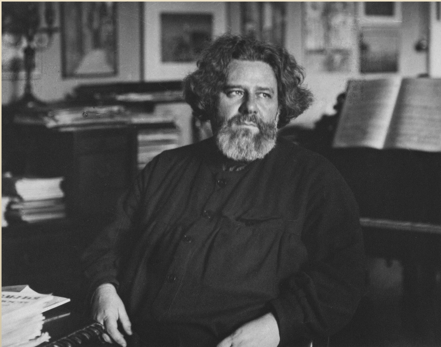
Максимилиан Волошин 1877-1932