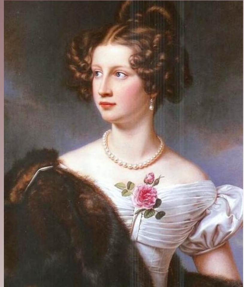
Амалия Крюденер (1823)