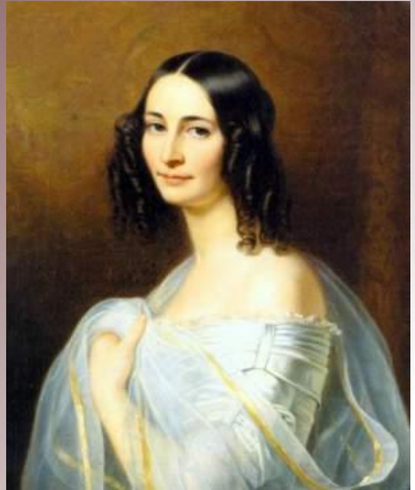
Эрнестина Дёрнберг (1833)