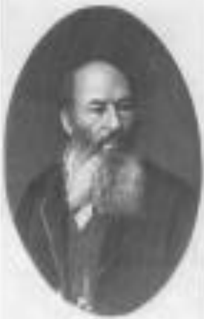
А.А. Фет Мин. Внутренних Дел имп. России

Лирика Фета тематически крайне бедна: красота природы и женская любовь - вот и вся тематика. Но какой огромной мощи достигает Фет в этих узких пределах.