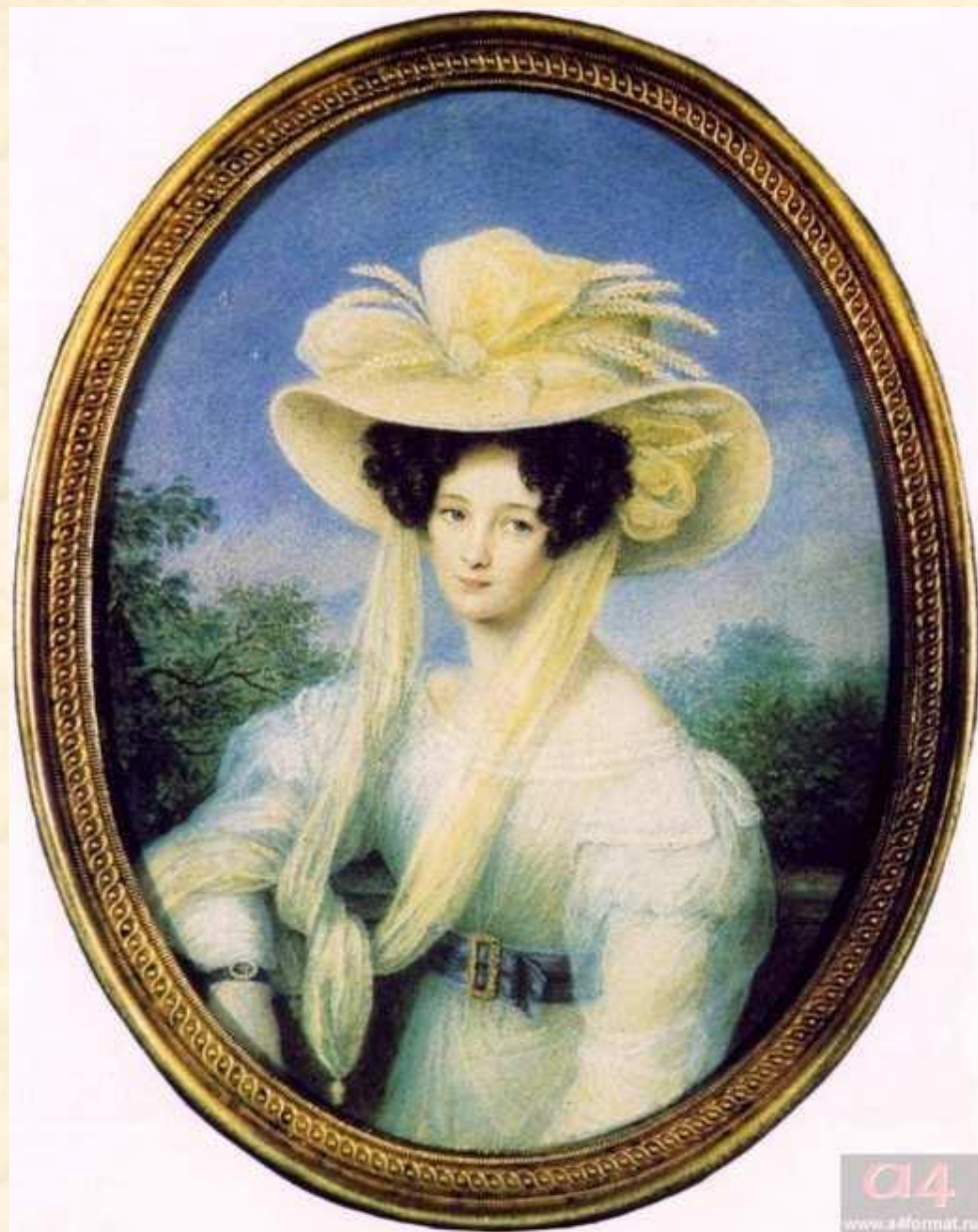
Элеонора Ботмер, первая жена Ф.И. Тютчева. Миниатюра И. Щелера. 1830-е

1826 год – Тютчев женится на графине Ботмер. Их семью посещает вся баварская интеллигенция. Тютчев переводит на русский язык стихотворение Гейне «С чужой стороны». Перевод произведения назывался «Сосны» и годом позже был напечатан в «Аонидах». Известно также, что Федор Иванович спорил с