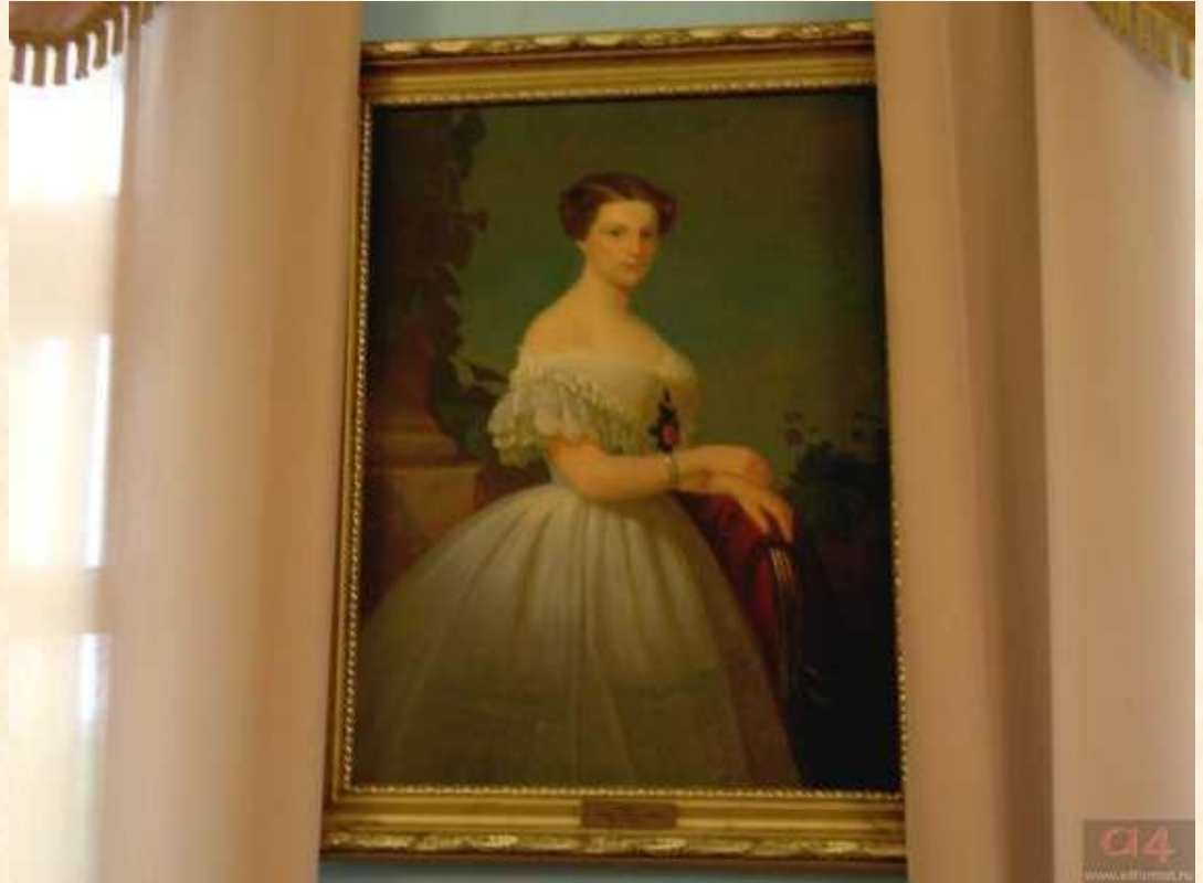
Амалия Адлерберг. Художник А. Цебенс. 1865

Весной 1823 года Тютчев влюбился в совсем ещё юную Амалию фон Лерхенфельд. Амалия лишь считалась дочерью видного мюнхенского дипломата графа Максимилиана фон Лерхенфельд-Кеферинга. На самом деле она была внебрачной дочерью прусского короля Фридриха-Вильгельма III и княгини Турн-и-Таксис (и являлась, таким образом, побочной сестрой другой дочери этого короля-русской императрицы Александры Федоровны).