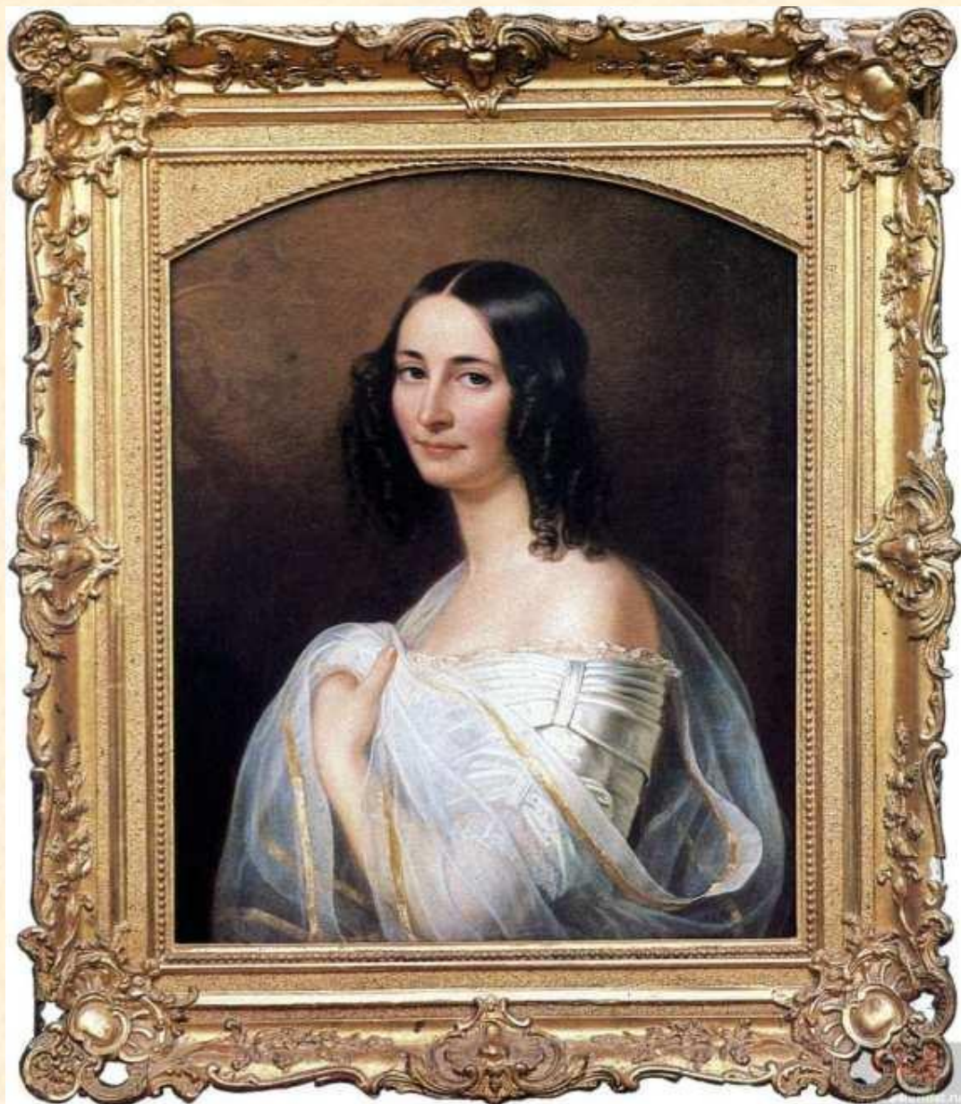
Эрнестина Пфеффель, вторая жена поэта. Художник Ф. Дюрк. Начало 1840-х

1839 год – Тютчев женится на баронессе Дернгейм. В этом же году за самовольный отъезд в Швейцарию (чтобы заключить брак) он отставлен со службы и лишен звания камергера. Тютчев с женой переезжают в Мюнхен.