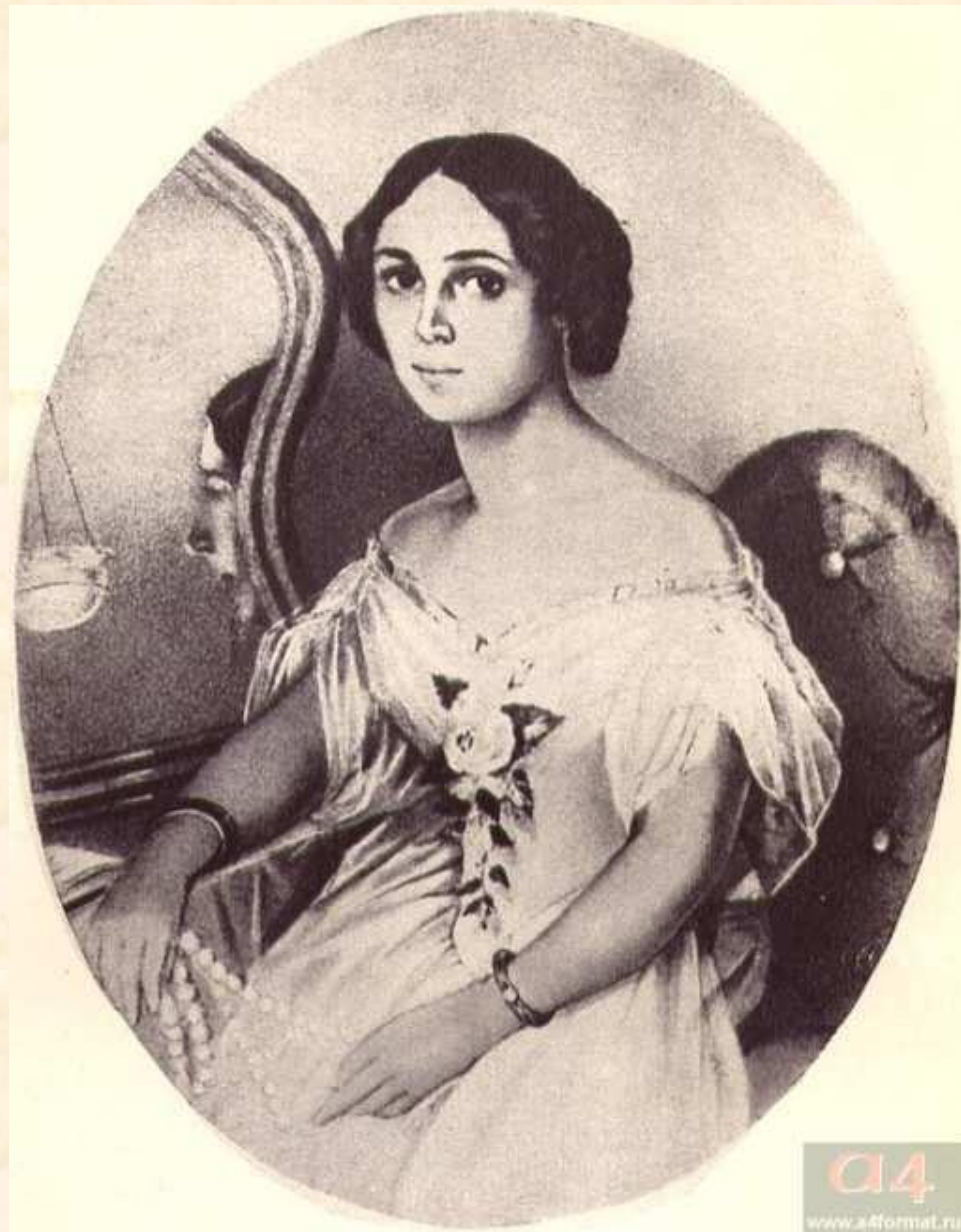
Е.И. Денисьева. Художник Иванов. 1850-е