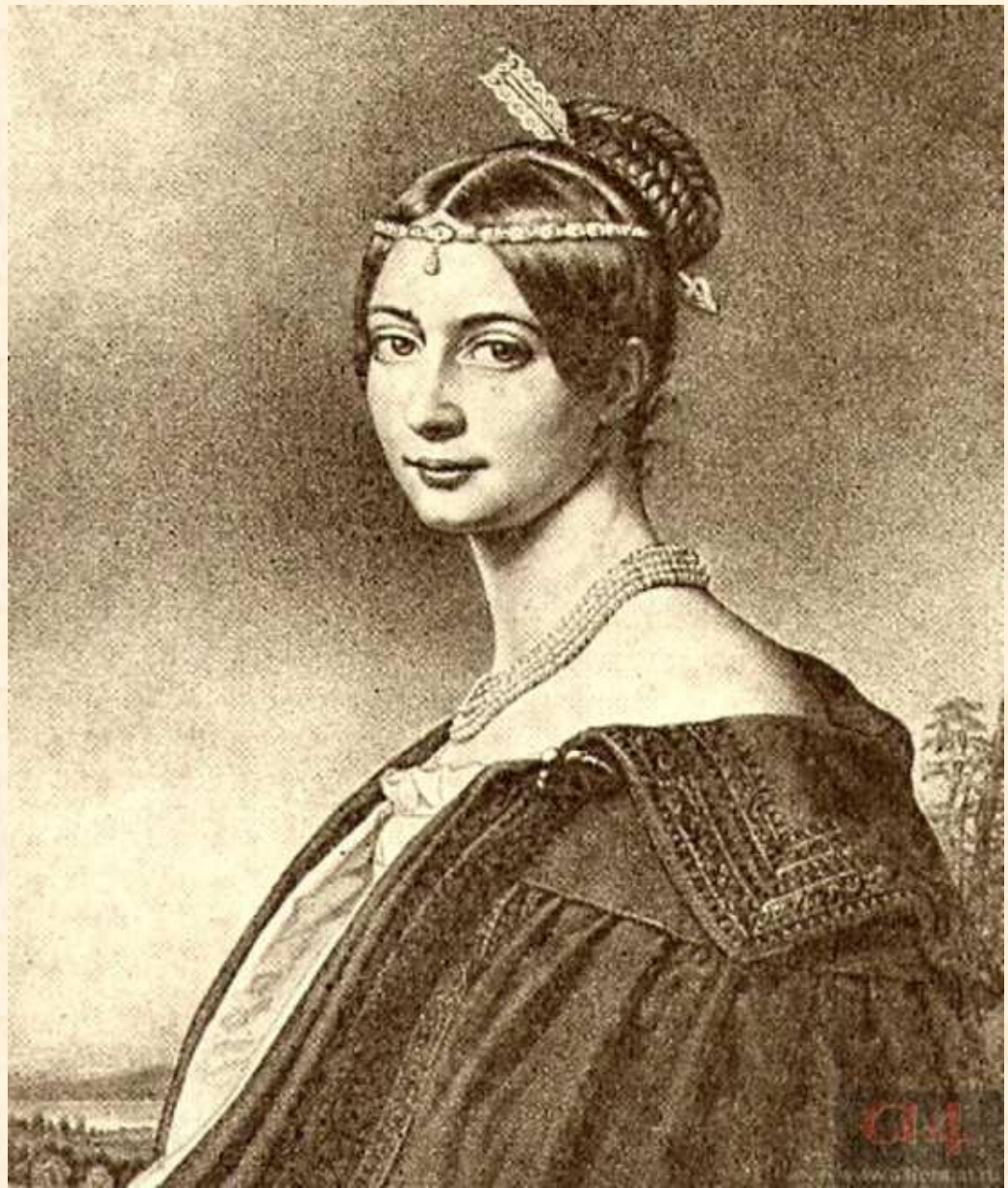
Эрнестина Дёрнберг. Литография Г. Бодмера с портрета работы Й. Штилера. Мюнхен. 1833

Люблю глаза твои, мой друг, С игрой их пламенно- чудесной, Когда их приподынешь вдруг И, словно молнией небесной, Окинешь бегло целый круг... Но есть сильнее очарованья: Глаза потупленные ниц, В минуты страстного лобзанья, И сквозь опущенных ресниц Угрюмый, тусклый огонь желанья.