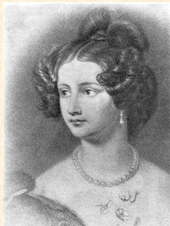
Амалия Крюденер. Фотография с портрета маслом работы художника И.Штилера. 1838 г.

Таков горе - духов блаженный свет; Лишь в небесах сияет он, небесный; В ночи греха, на дне ужасной бездны, Сей чистый огонь, как пламень адский, жжет.