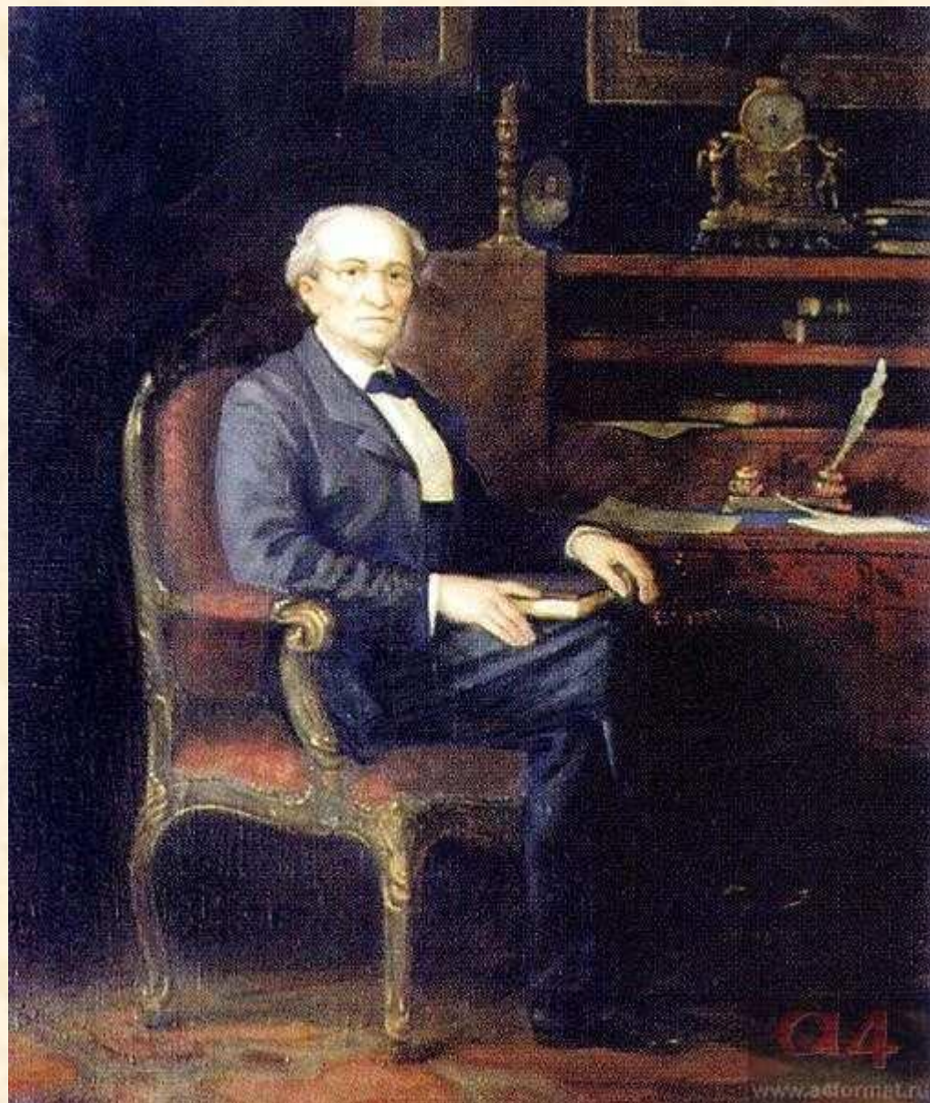
Ф.И. Тютчев. Художник М. Решетнев