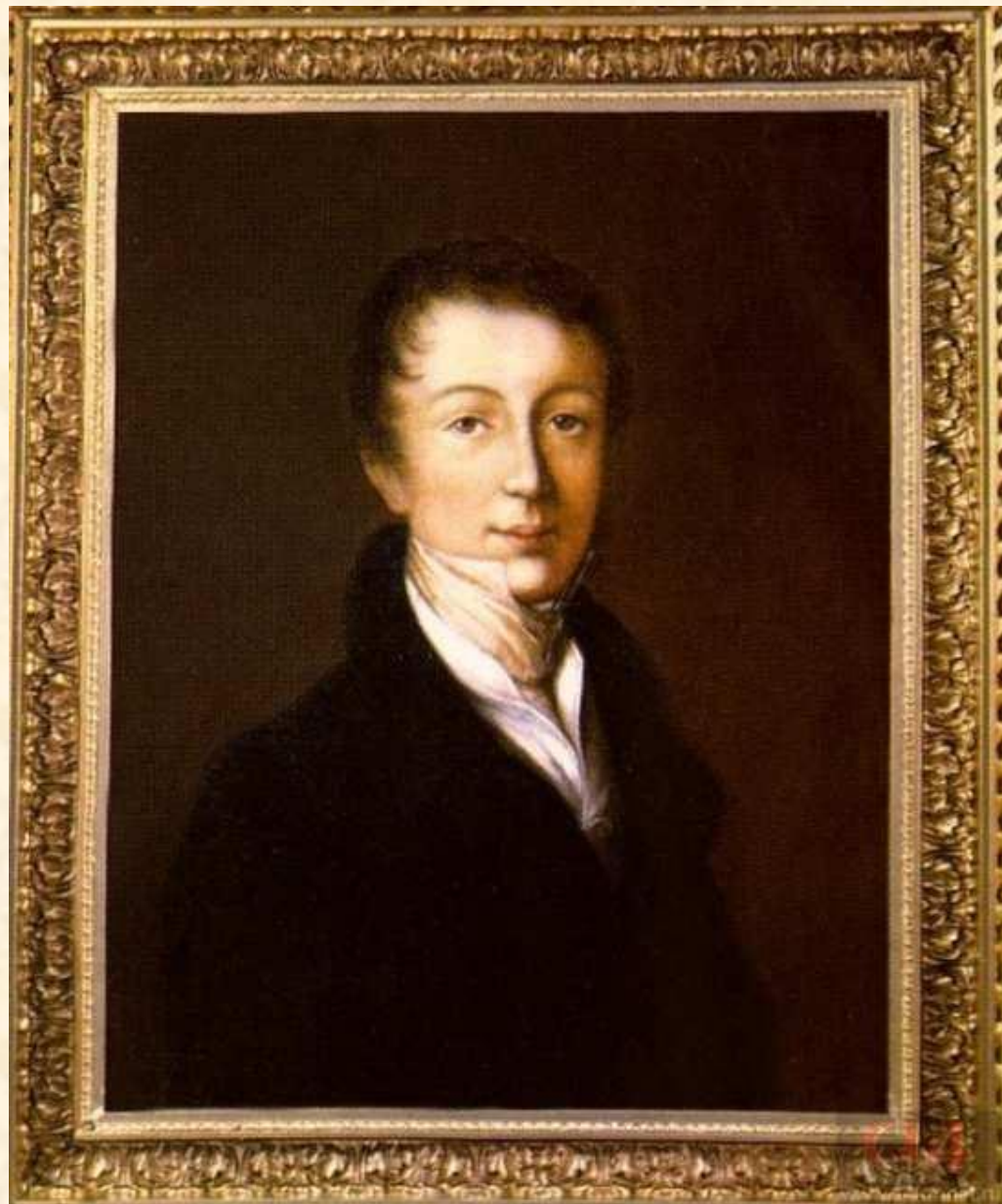
Ф.И. Тютчев. Неизвестный художник. 1819–1820

Я помню время золотое, Я помню сердцу милый край. День вечерел; мы были двое; Внизу, в тени, шумел Дунай. И на холму, там, где, белея, Руина замка вдаль глядит, Стояла ты, молодая фея, На мшистый опершись гранит. Ногой младенческой касаясь Обломков груди вековой; И солнце медлило, прощаясь С холмом, и с замком, и тобой. И ветер тихий мимолетом Твоей одеждою играл И с диких яблонь цвет за цветом На плечи юные свевал. Ты беззаботно вдаль глядела... Край неба дымно гас в лучах; День догорал; звучнее пела Река в померкших берегах. И ты с веселостью беспечной Счастливым провожала день; И сладко жизни быстротечной Над нами пролетала тень.