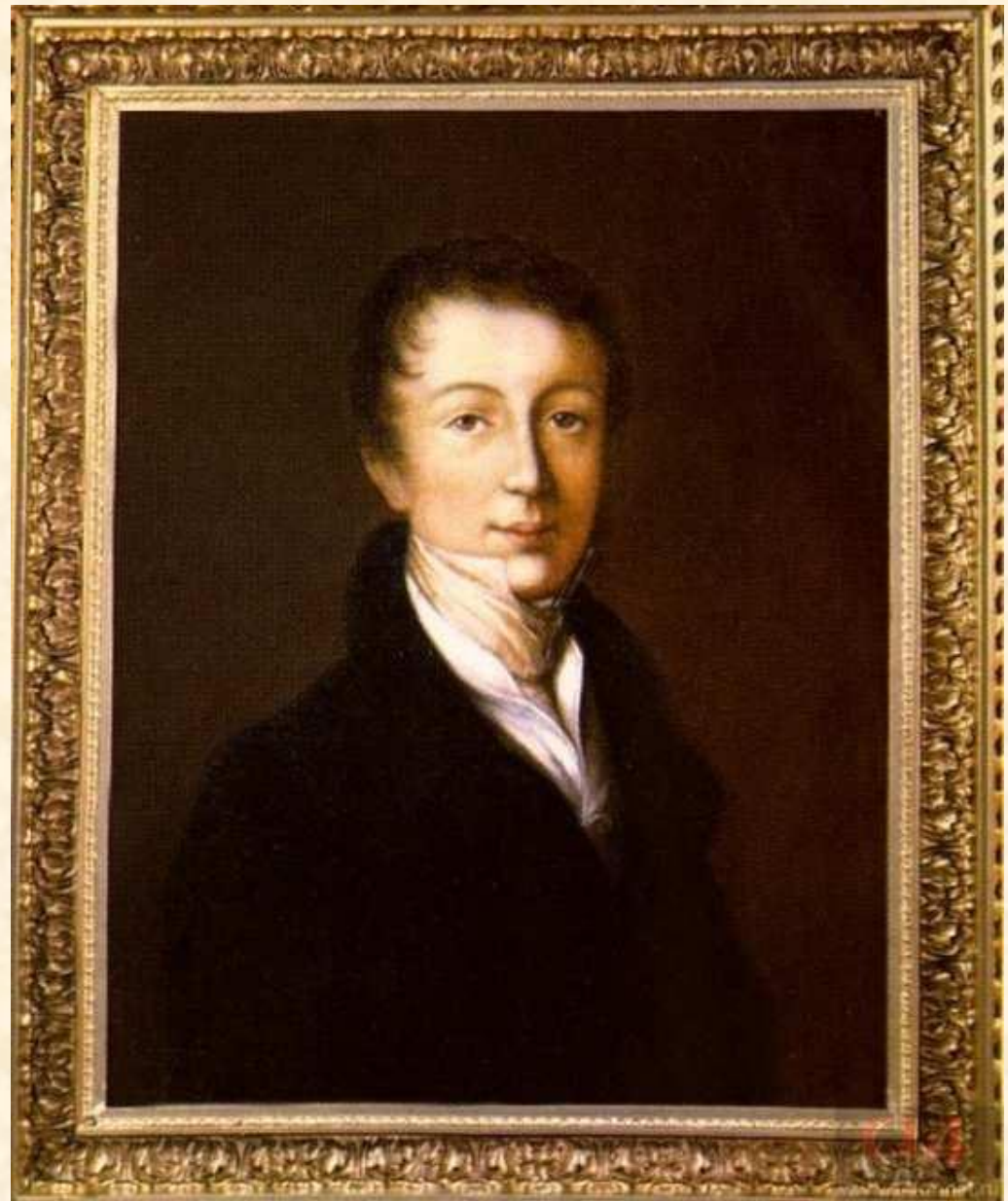
Ф.И. Тютчев. Неизвестный художник. 1819–1820

Я помню время золотое, Я помню сердцу милый край. День вечерел; мы были двое; Внизу, в тени, шумел Дунай. И на холму, там, где, белея, Руина замка вдаль глядит, Стояла ты, молодая фея, На мшистый опершись гранит. Ногой младенческой касаясь Обломков груди вековой; И солнце медлило, прощаясь С холмом, и с замком, и тобой. И ветер тихий мимолетом Твоей одеждою играл И с диких яблонь цвет за цветом На плечи юные свевал. Ты беззаботно вдаль глядела... Край неба дымно гас в лучах; День догорал; звучнее пела Река в померкших берегах. И ты с веселостью беспечной Счастливым провожала день; И сладко жизни быстротечной Над нами пролетала тень.