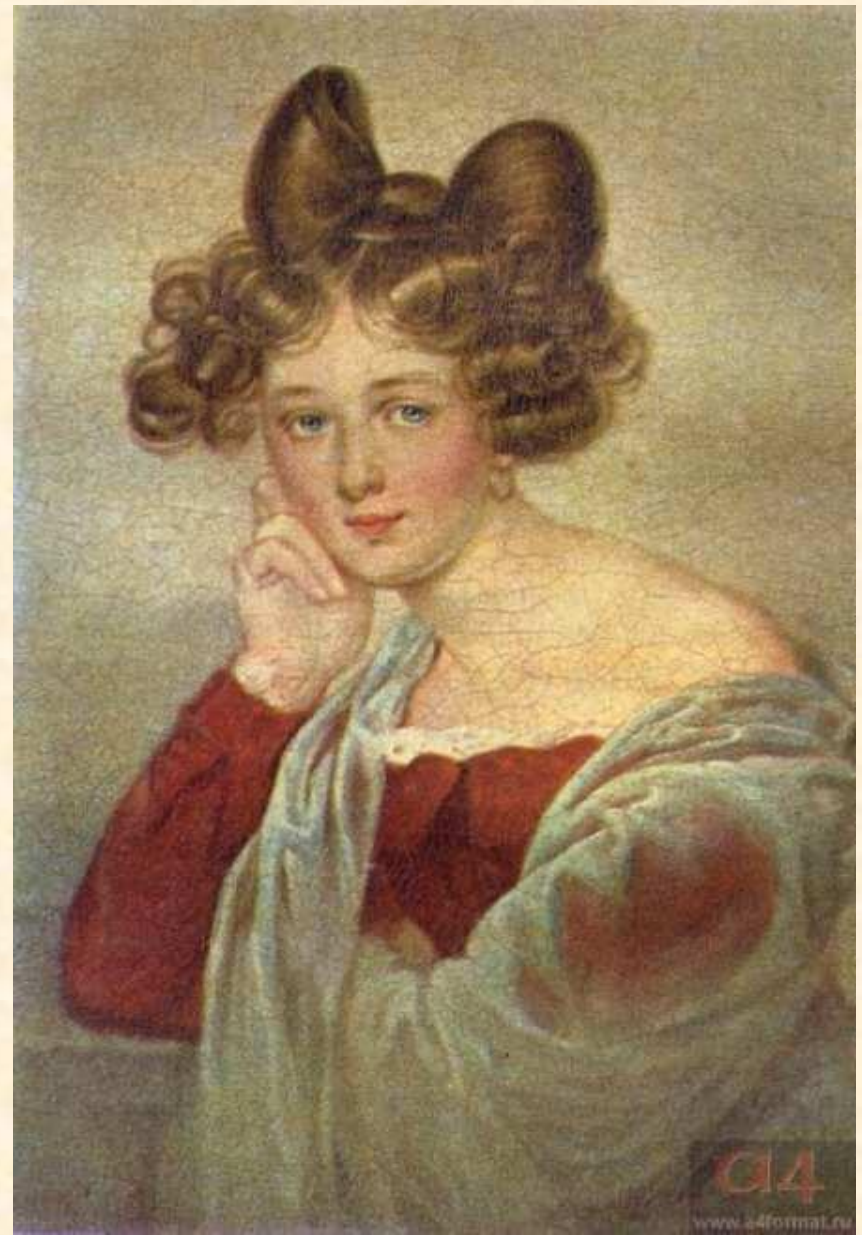
Элеонора Тютчева, первая жена поэта. Художник И. Штилер. 1830-е