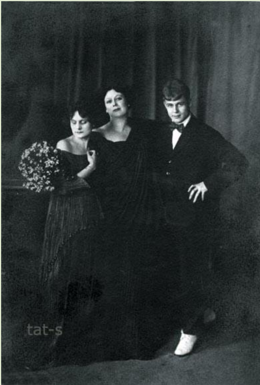
Приемная дочь Айседоры Ирма Дункан (1898 - 1978), Айседора Дункан, Сергей Есенин. Москва. Фото - май, 1922 год.