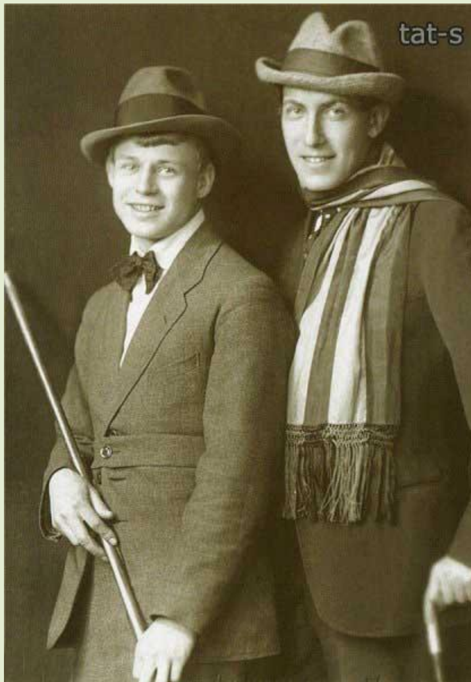
Сергей Есенин (слева) и Анатолий Борисович Мариенгоф (1897 - 1921) Москва, лето. Фото -1919 год.