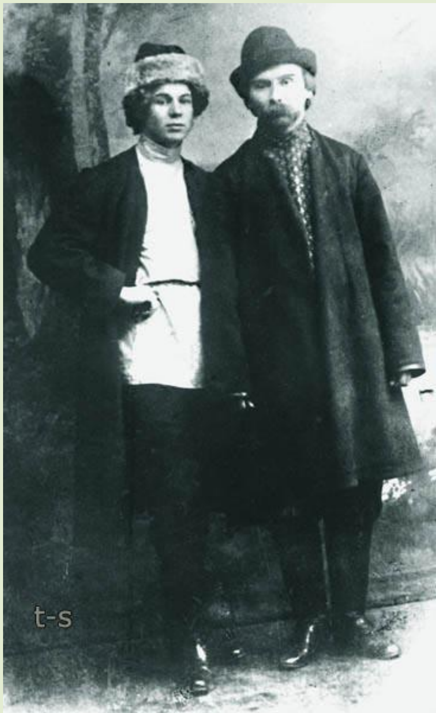
Поэты - Сергей Есенин (слева) и Николай Клюев Фото - 1916 год.