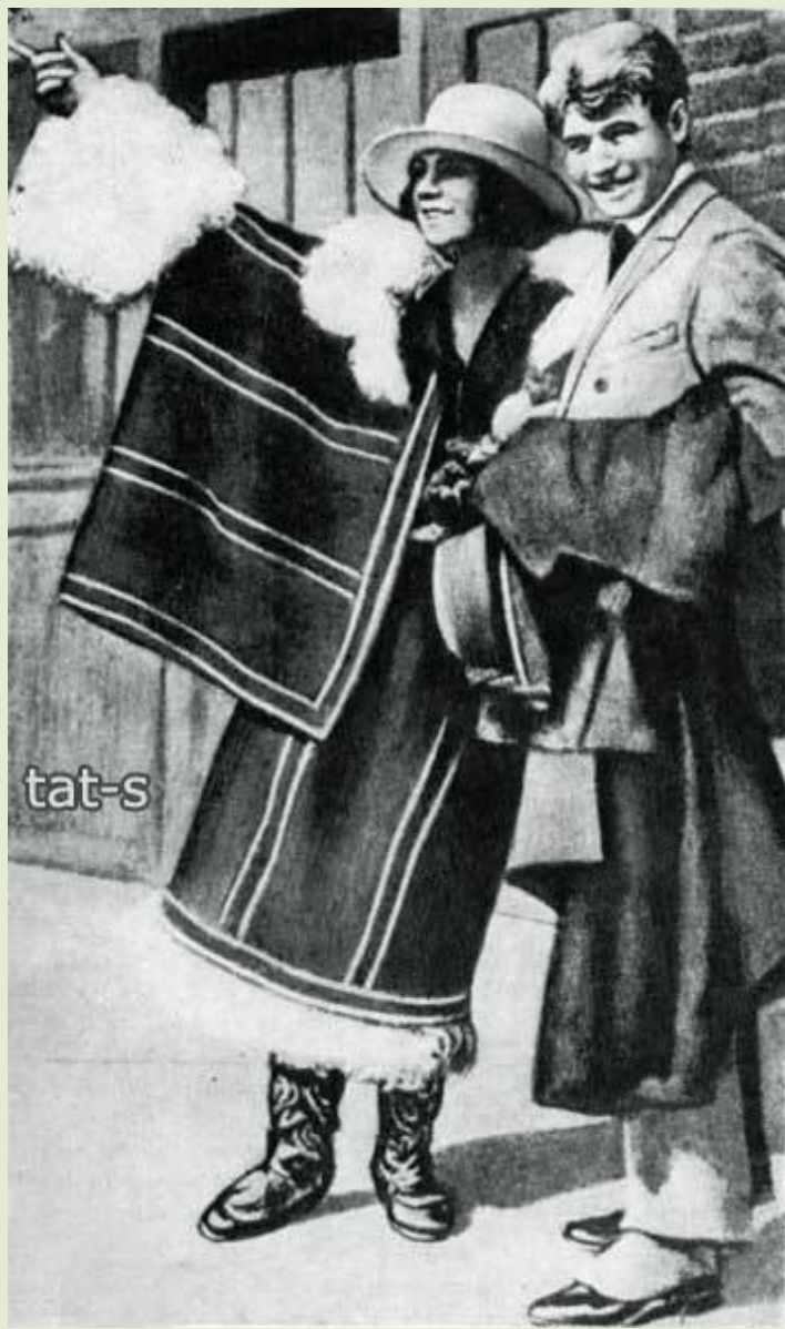
Сергей Есенин и Айседора Дункан на пароходе "Paris". Фото - октябрь 1922 год.