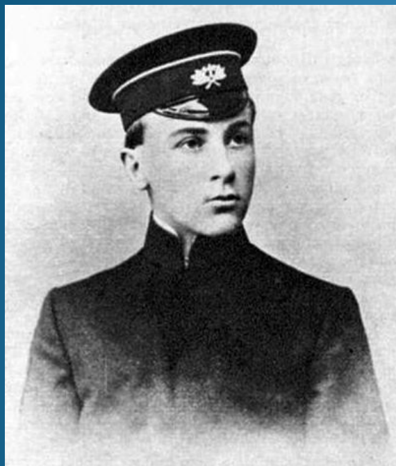
Михайло Булгаков, 1908 р.

Російський письменник українського походження, драматург, театральний режисер.