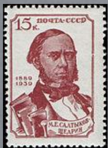
1939 г. 30 копеек

В СССР были выпущены почтовые марки, посвященные Салтыкову-Щедрину.