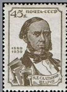
1939 г. 45 копеек