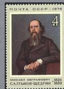
1958 г. Почтовая марка СССР