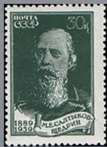
1939 г. 30 копеек