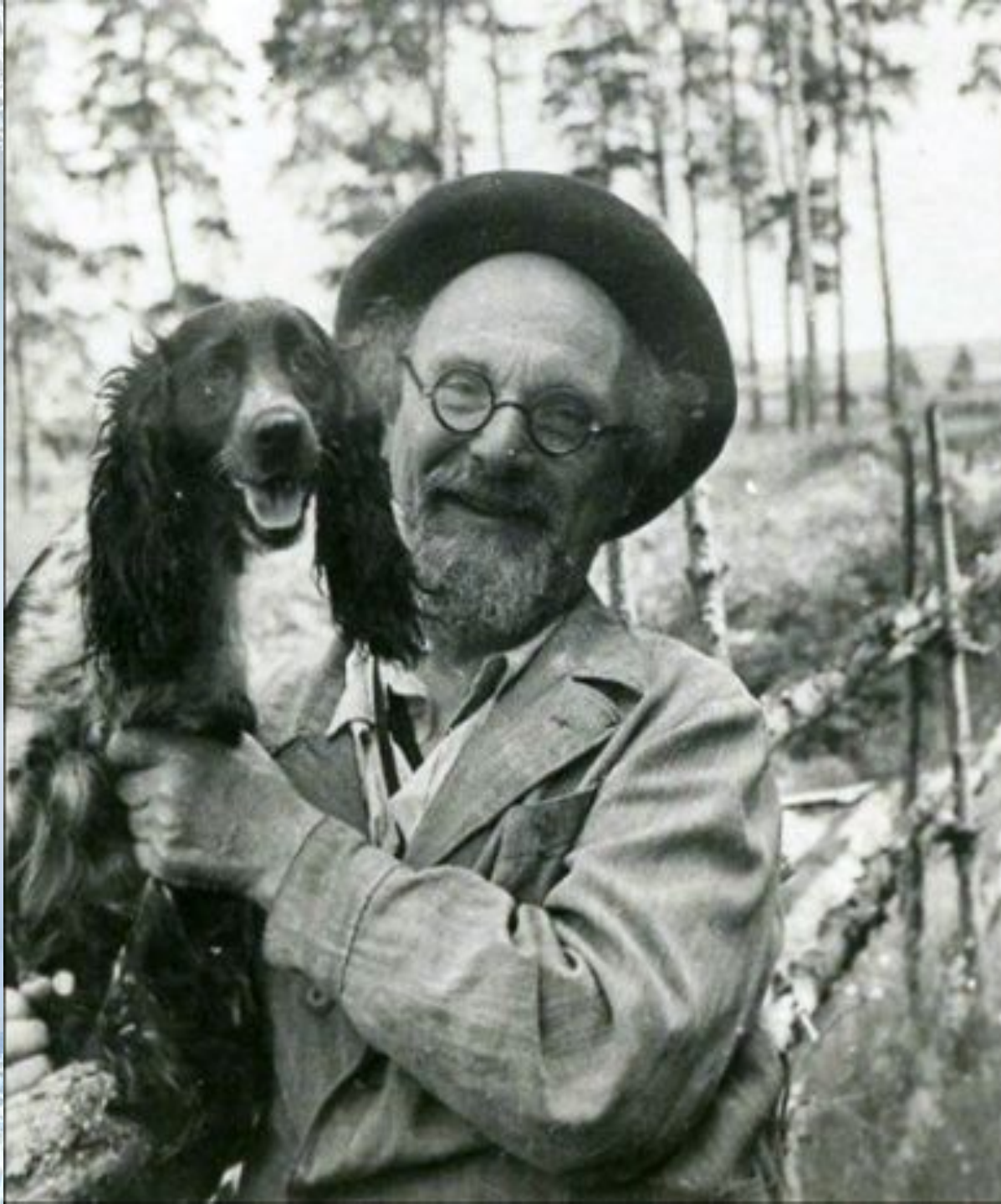
Пришвин Михаил Михайлович