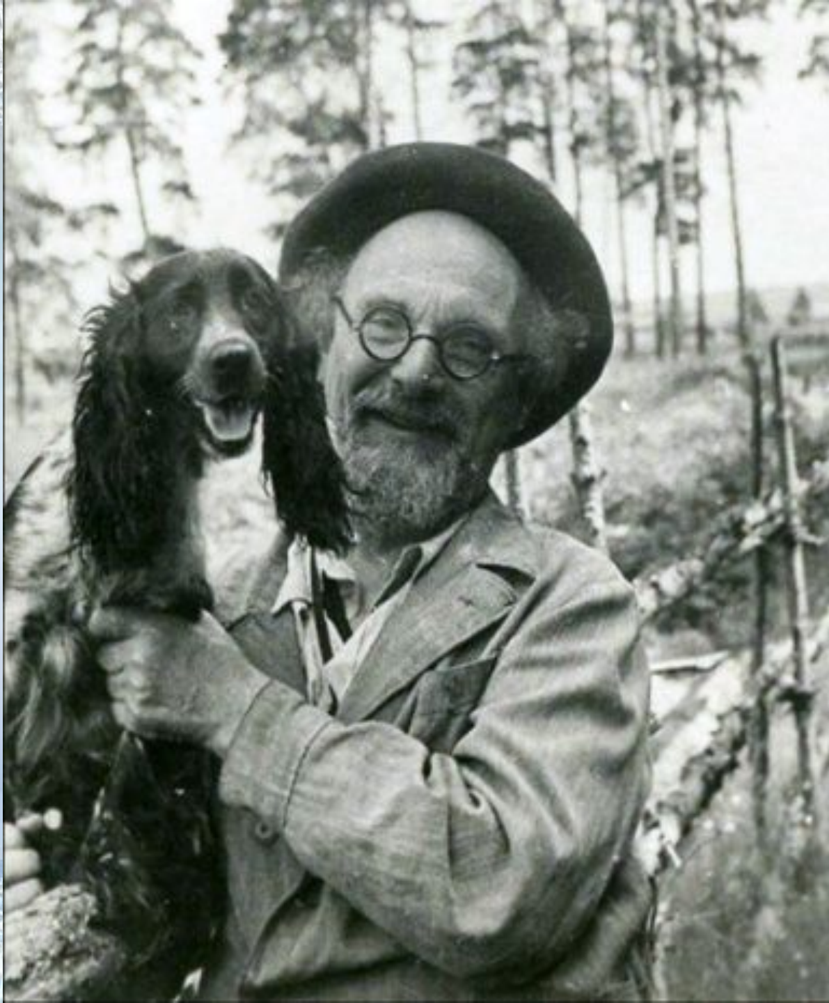
Пришвин Михаил Михайлович