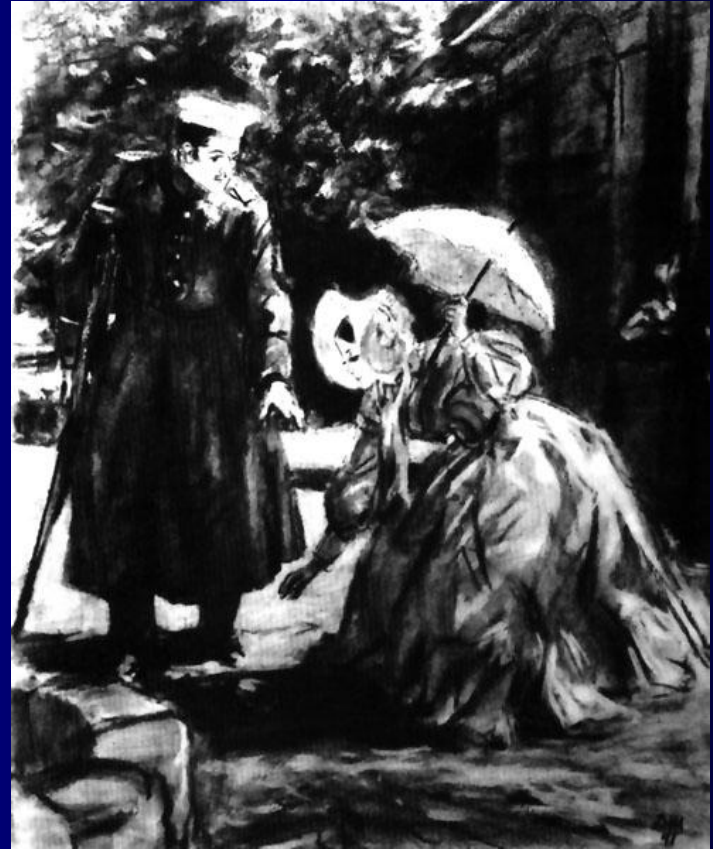
Княжна Мери и Грушницкий