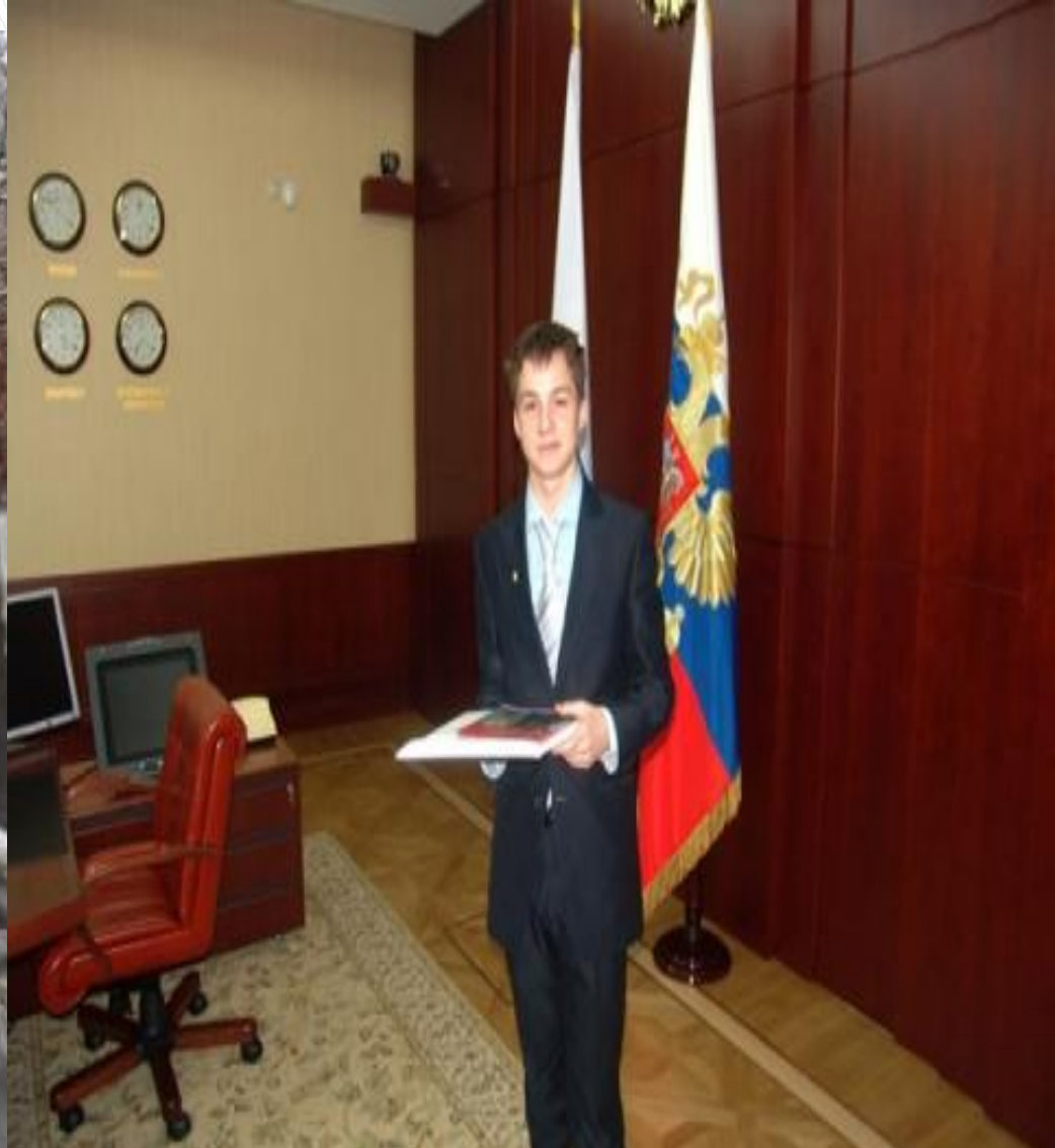
В кабинете у президента (13 лет)