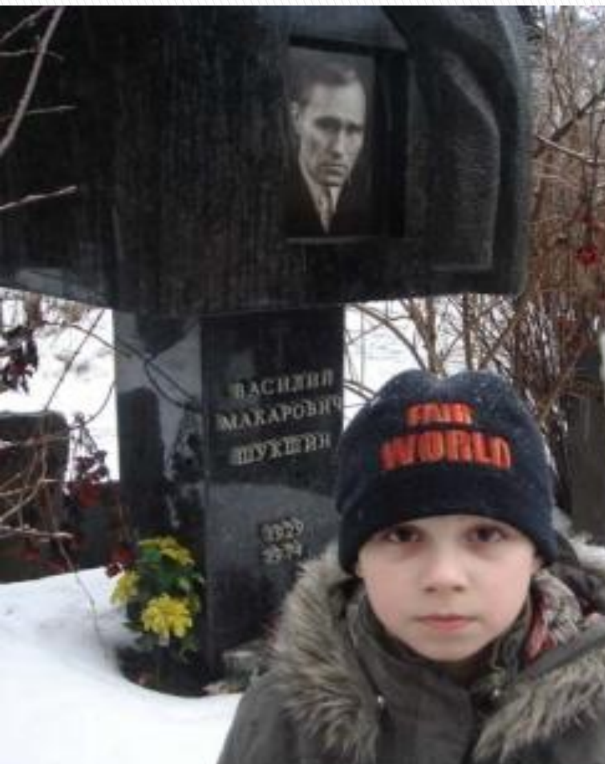
На могиле у Шукшина (8 лет)