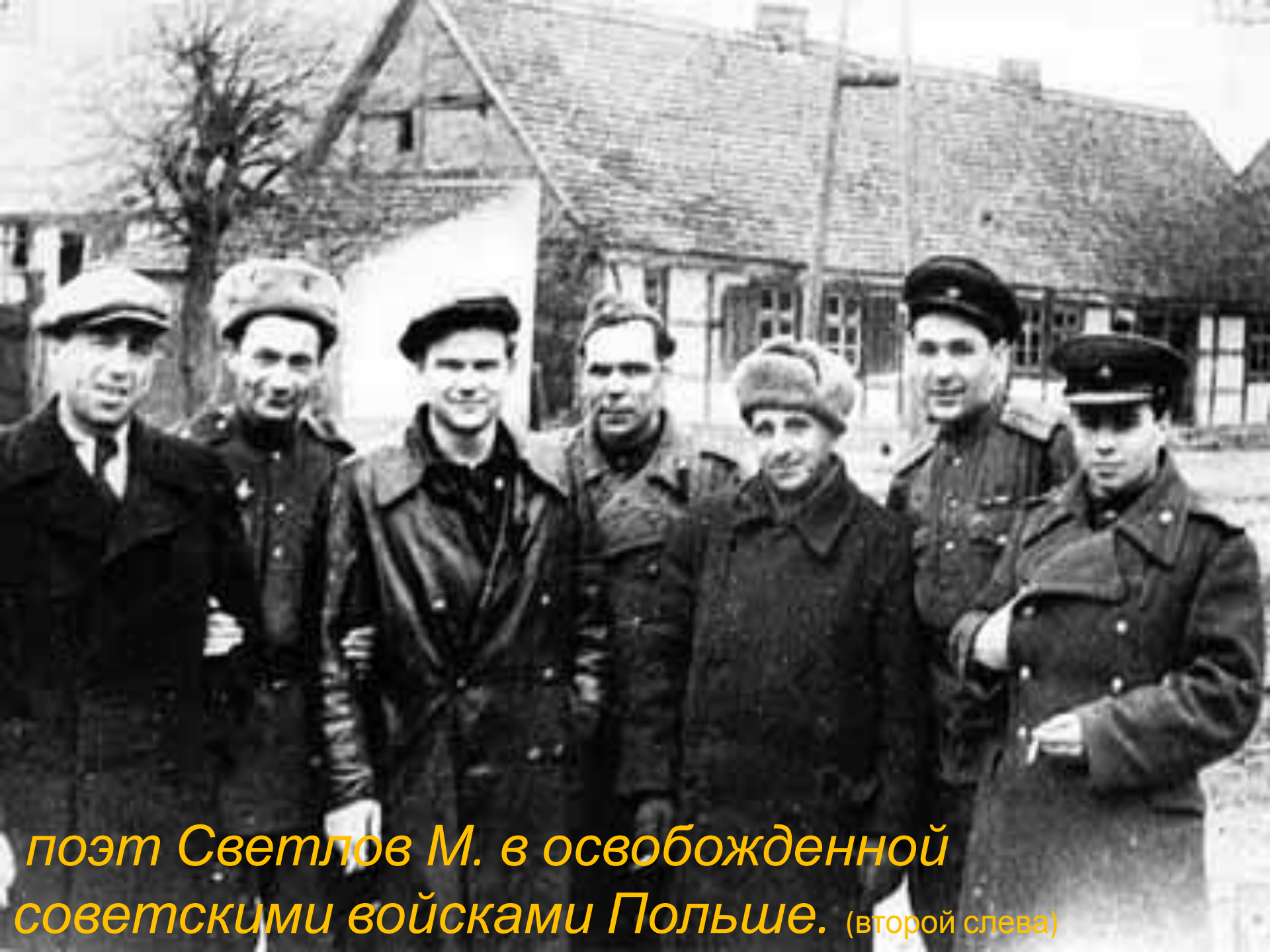
поэт Светлов М. в освобожденной советскими войсками Польше. (второй слева)