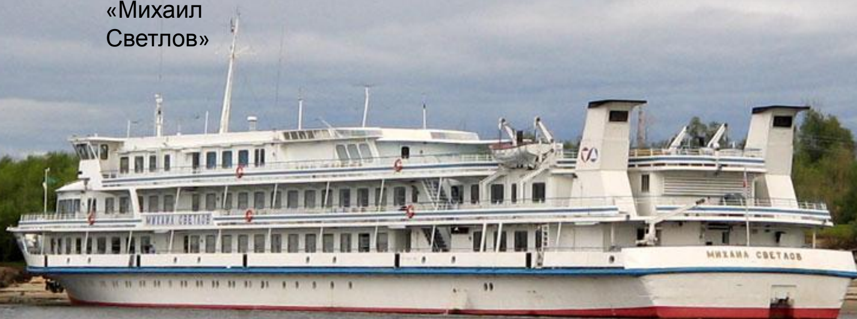
Теплоход «Михаил Светлов»