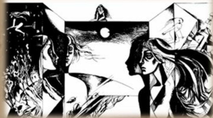
Иллюстрация Н. Зеленченко

Из всех линий романа история мастера и Маргариты самая главная, она наиболее близка нам. Рождаясь, как отголосок бессмертной библейской истории, она пересекает всё пространство от края до края, словно чистый прозрачный ручей, прорываясь сквозь все завалы и препятствия и уходя, уходя в потусторонний мир, вечность. К ней сходятся все события и явления.