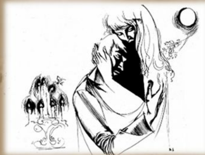
Иллюстрация Н. Зеленченко