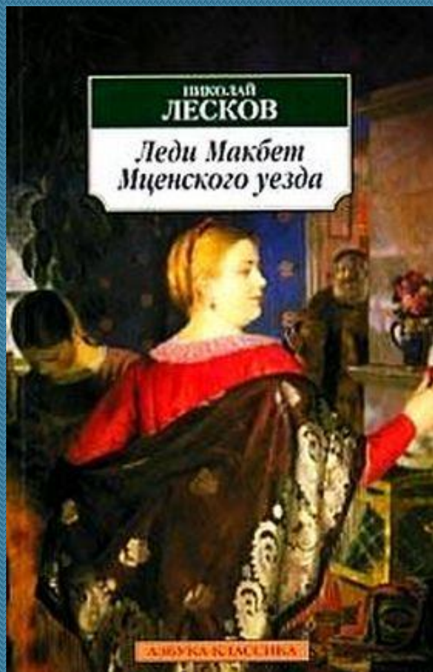
повесть Лескова «Леди Макбет Мценского уезда»