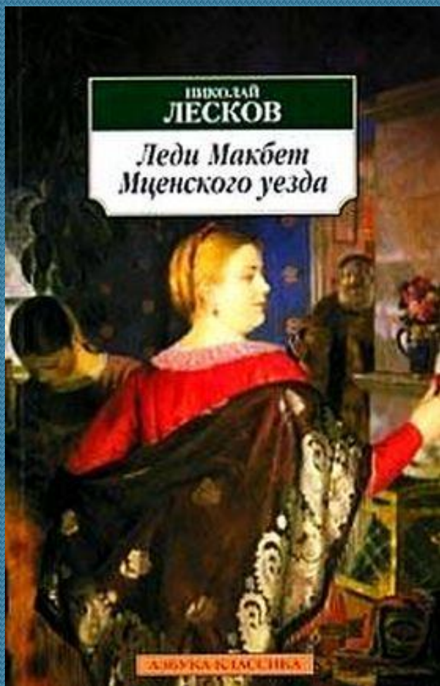
повесть Лескова «Леди Макбет Мценского уезда»