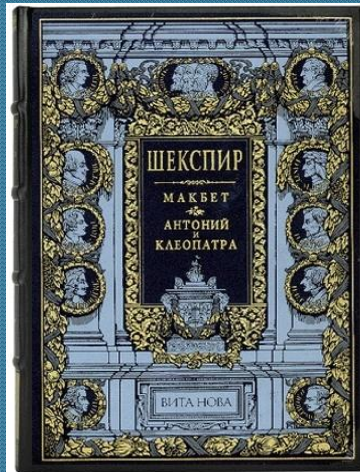
Трагедия В. Шекспира «Макбет»