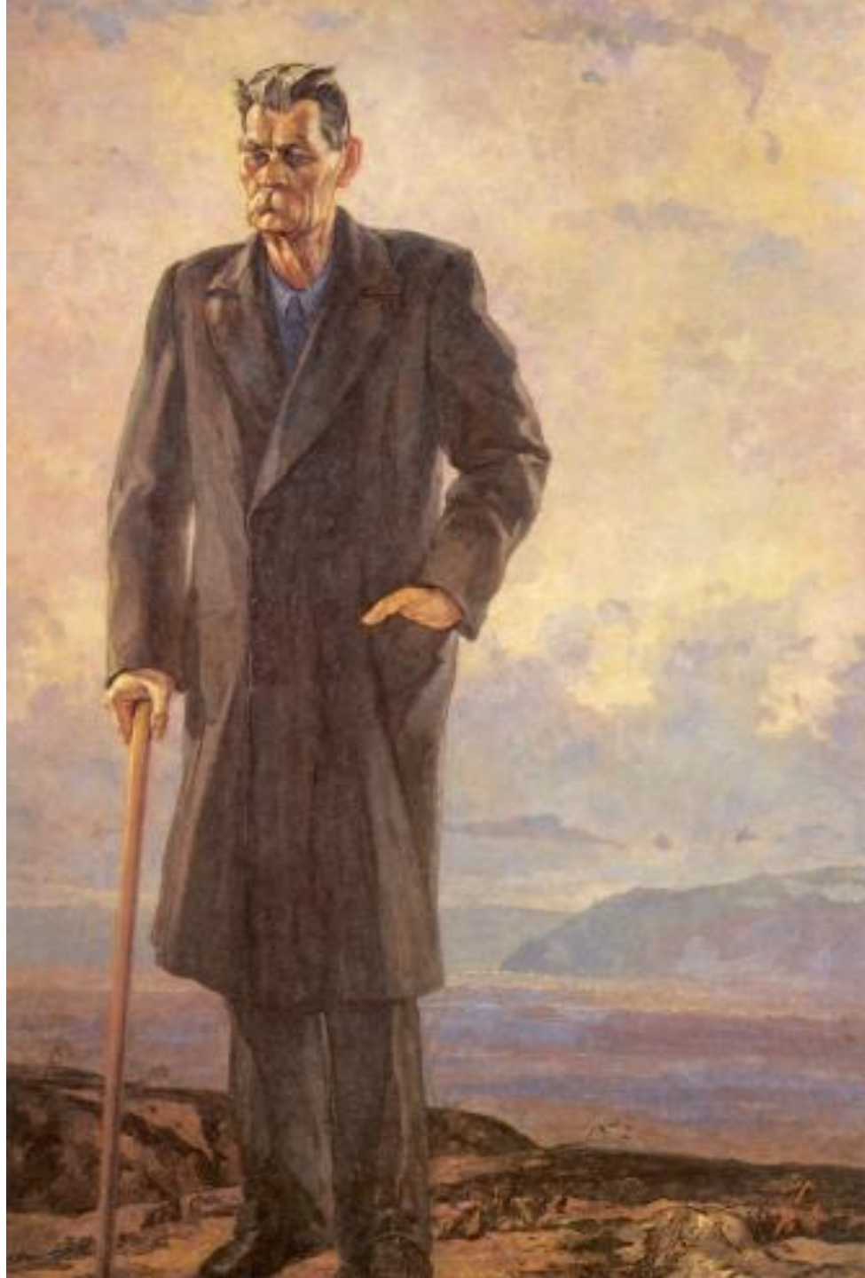
П. Корин. Портрет М. Горького, Сорренто, 1932