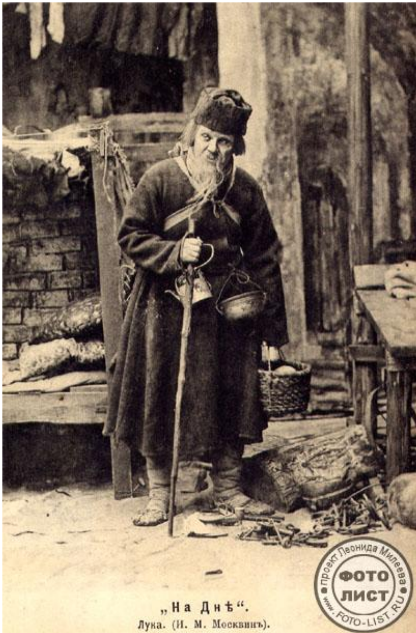
Москвин И.М. в роли Луки («На дне», М. Горький). Дореволюционная открытка.