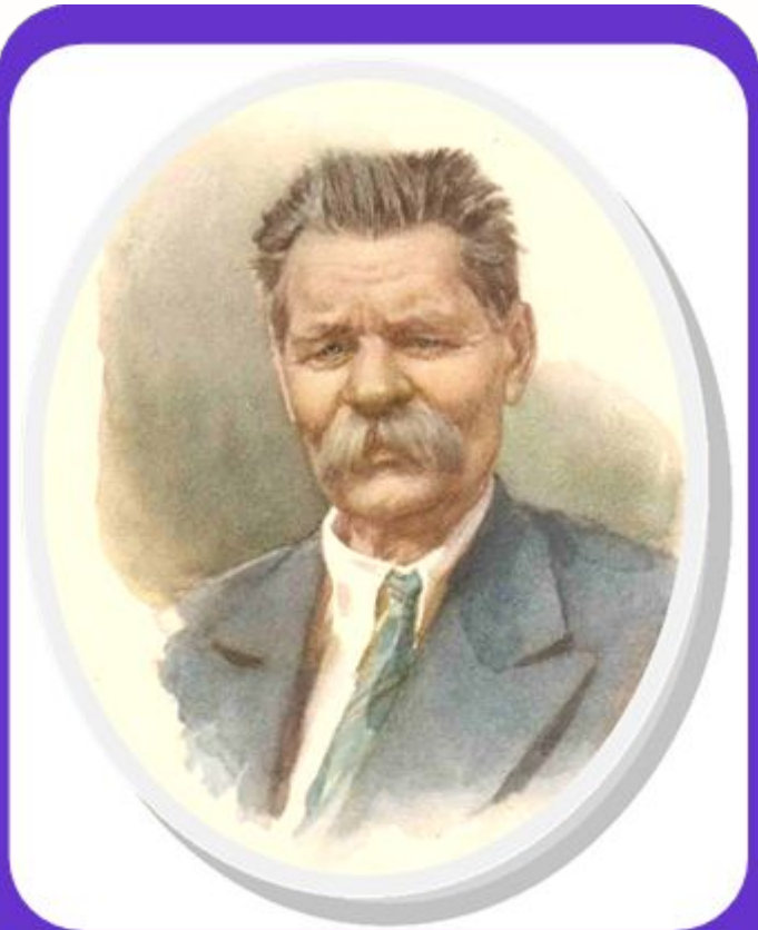
Горький (Пешков) Максим Алексеевич 1868-1936

первое произведение Максима Горького, напечатанное в журнале «Русское богатство» в 1895 году (№ 6) при содействии В. Г. Короленко. Написано в августе 1894 года в Нижнем Новгороде.