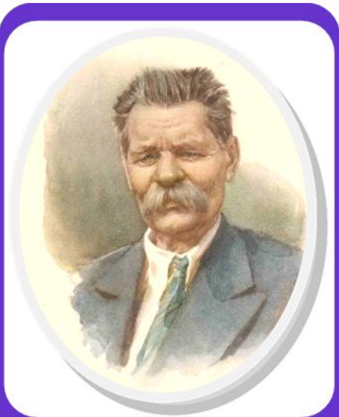
Горький (Пешков) Максим Алексеевич 1868-1936

первое произведение Максима Горького, напечатанное в журнале «Русское богатство» в 1895 году (№ 6) при содействии В. Г. Короленко. Написано в августе 1894 года в Нижнем Новгороде.