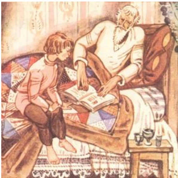
Иллюстрация к книге «Детство»