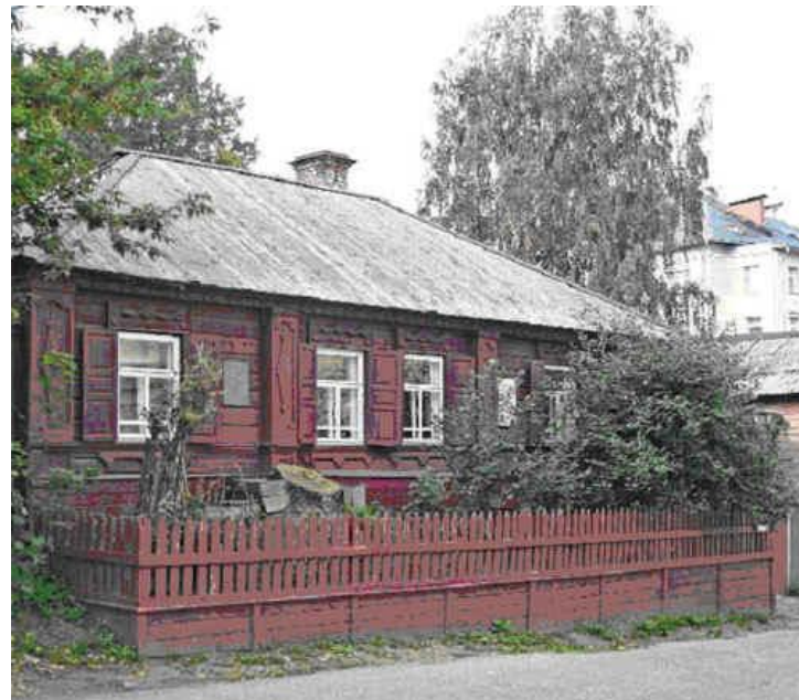
Дом-музей деда Каширина.