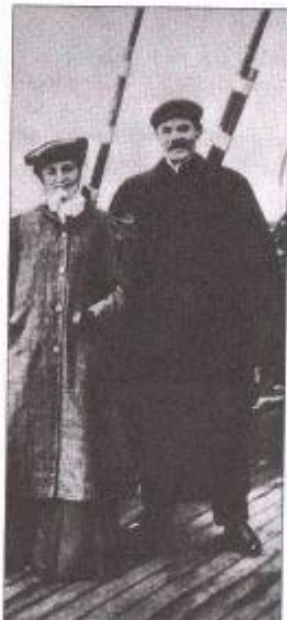
М. Горький и М. Андреева на пути в Америку. 1906

Статья «Буря энтузиазма...» о приезде Горького в США в газете «Нью-Йорк Таймс»