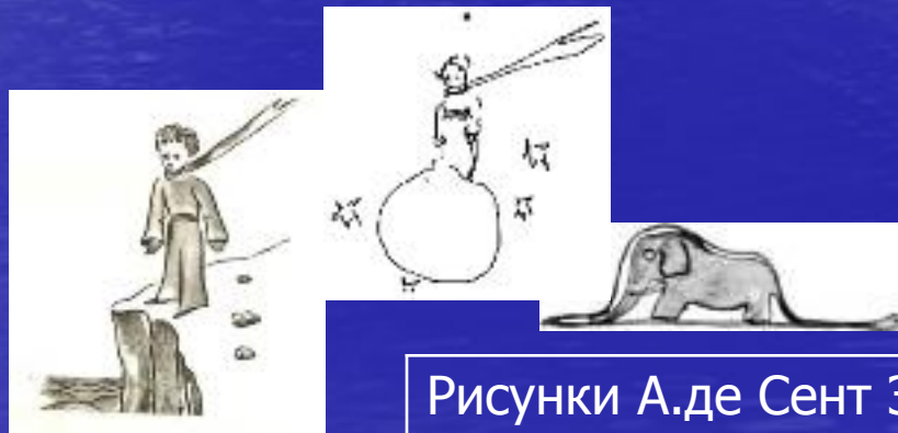
Рисунки А.де Сент Экзюпери

В своём проекте, я бы хотела рассказать о книге А.де Сент-Экзюпери «Маленький принц», показать интересные иллюстрации к ней, сделанные самим писателем и немного рассказать вам о его жизни.