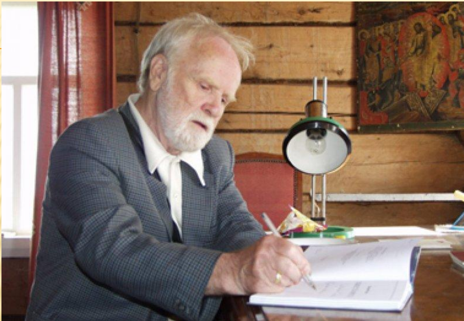
Василий Иванович Белов 23.10.1932 год