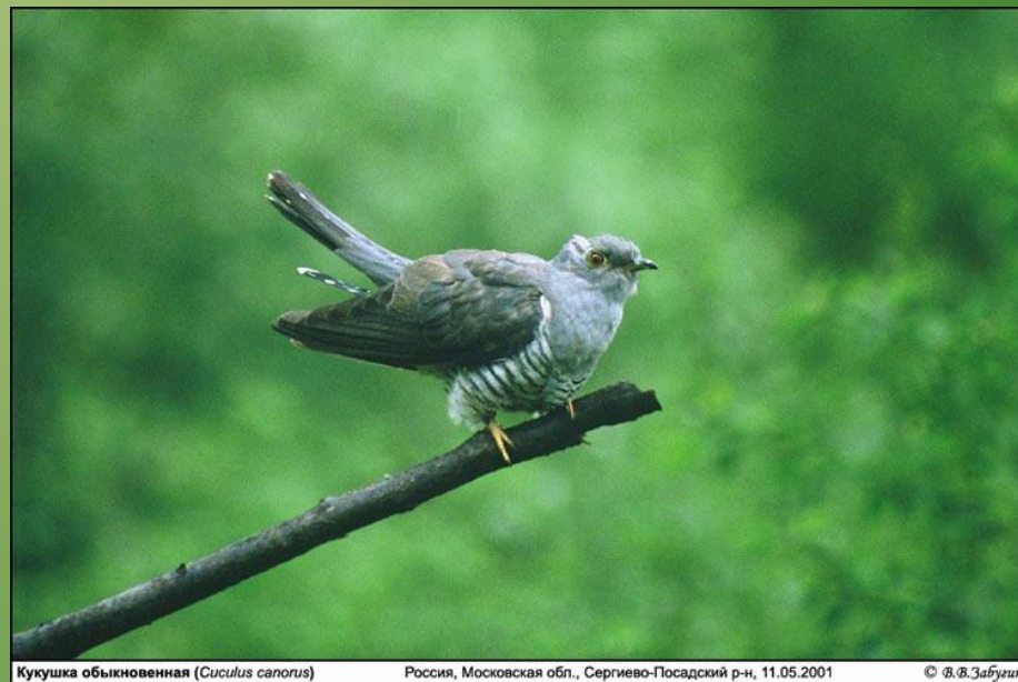
Кукушка обыкновенная ( Cuculus canorus )

Кукушечка, кукушечка, Серенька рябушечка, Прокукуй в лесу: ку-ку – Сколько лет я проживу?