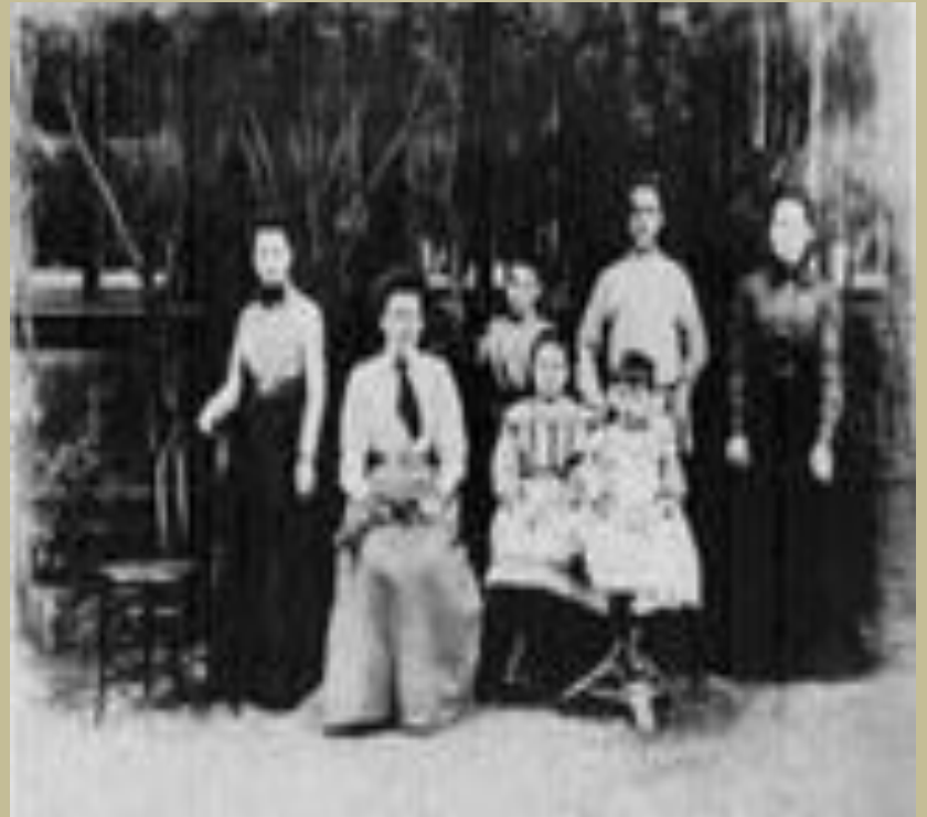
Семья Цветаевых в Тарусе.