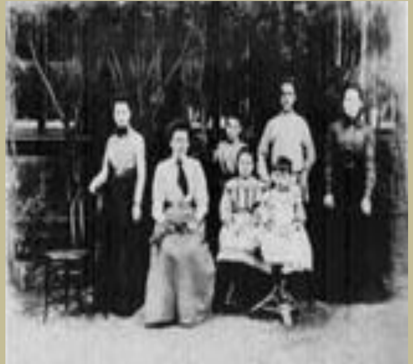
Семья Цветаевых в Тарусе.