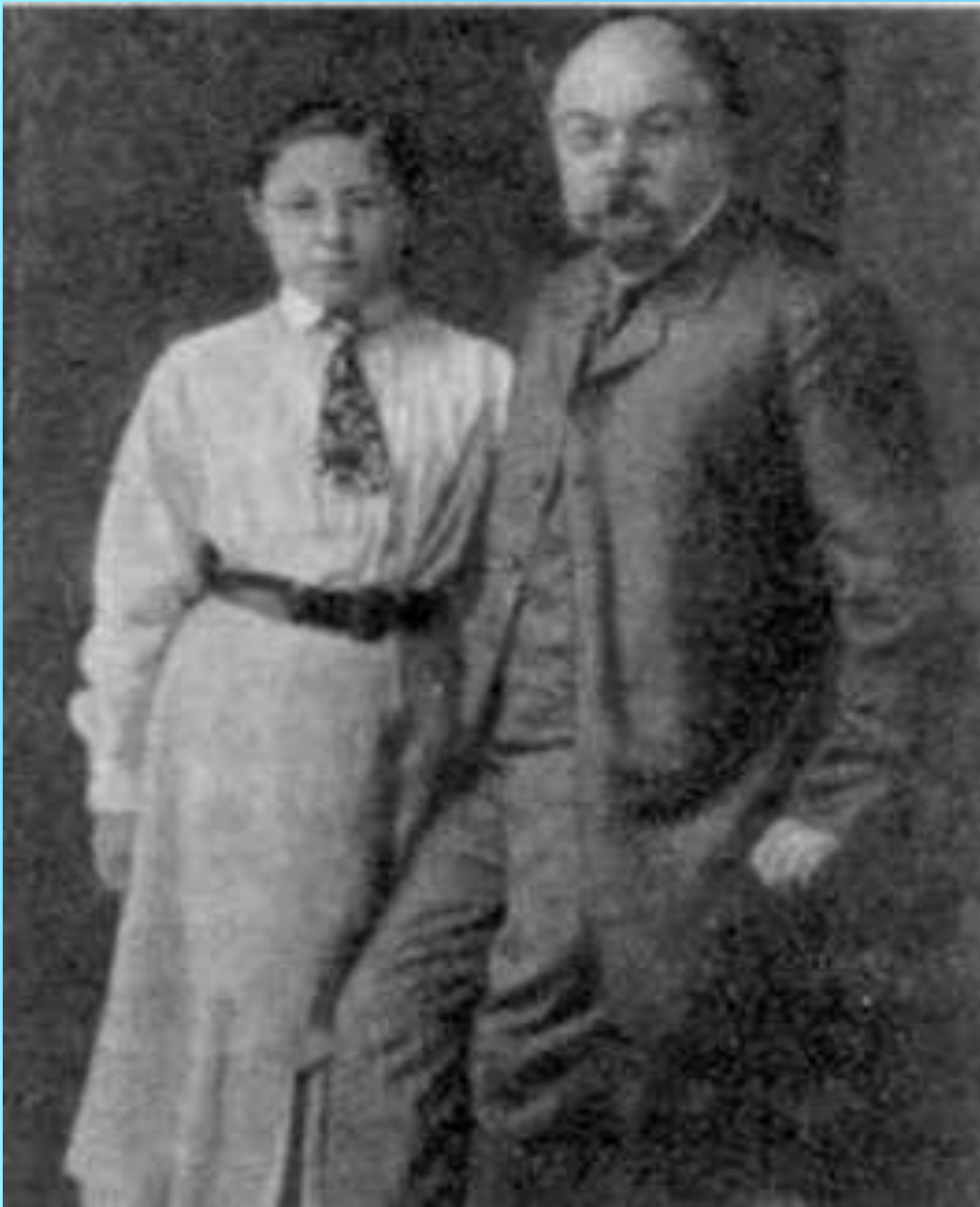
Марина Цветаева СО СВОИМ ОТЦОМ.