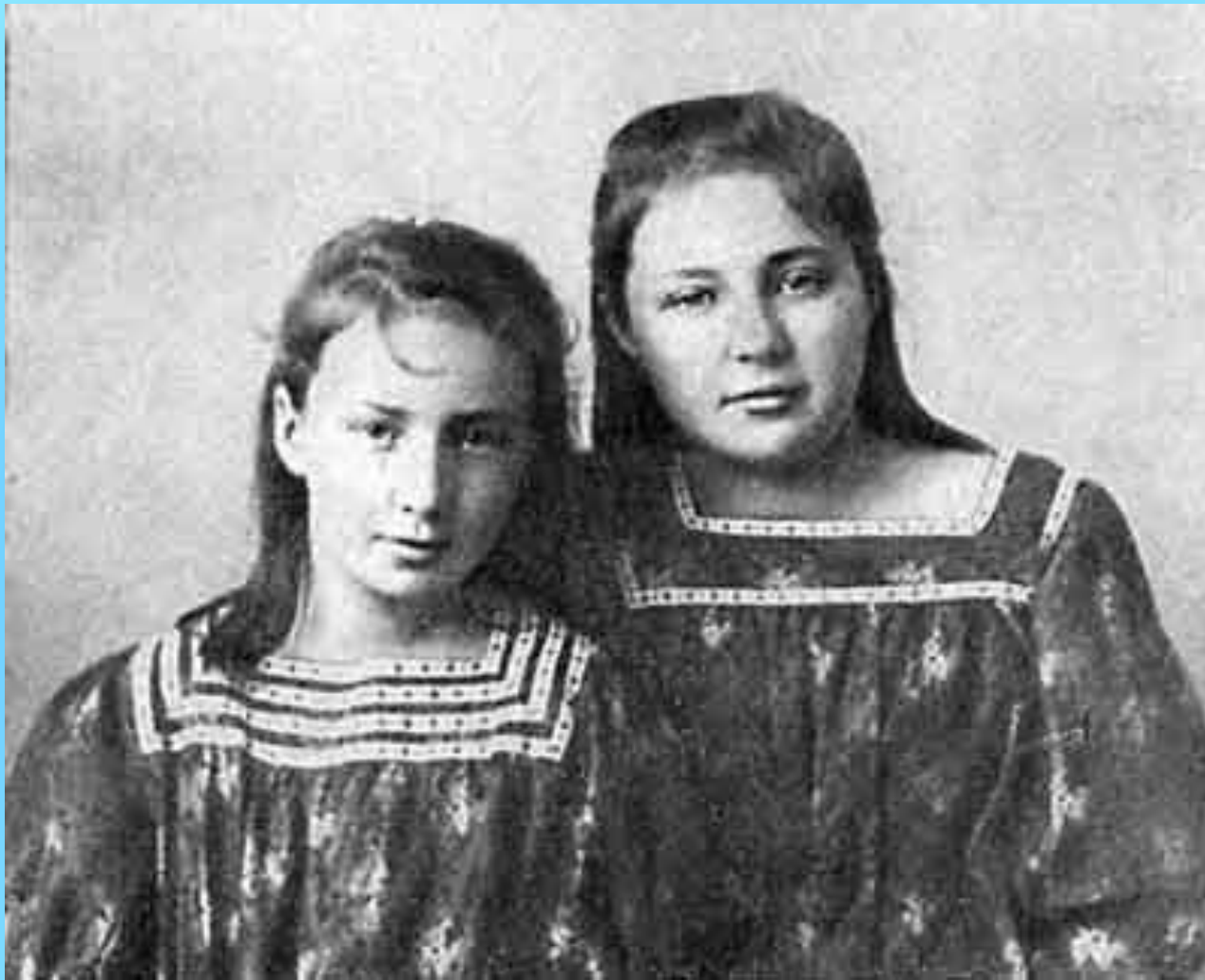
Марина и Анастасия Цветаевы