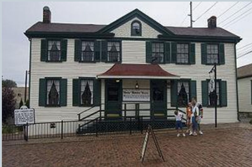
«Домик Бекки Тэтчер» (США, штат Миссури, г. Ганнибал)

Управление города Ганнибал, который расположен в штате Миссури США, предполагает отремонтировать «дом Бекки Тэтчер» и предоставить его для экскурсий как местную достопримечательность. Этот домик ранее принадлежал Лоре Хокинс, жившей в нём в 1840-е годы, которая, в своё время, и послужила Марку Твену прототипом к созданию образа Бекки для романа «Приключения Тома Сойера».