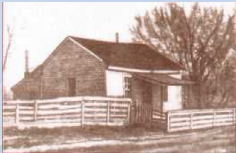
Дом в поселке Флорида, штат Миссури, где родился Сэмюэль Клеменс

достаточная, чтобы корабль не сел на мель. Одолевать реку ночью, в половодье, когда она меняет свое русло, — это был вызов для молодого лоцмана. Река открывала путь в огромный мир.