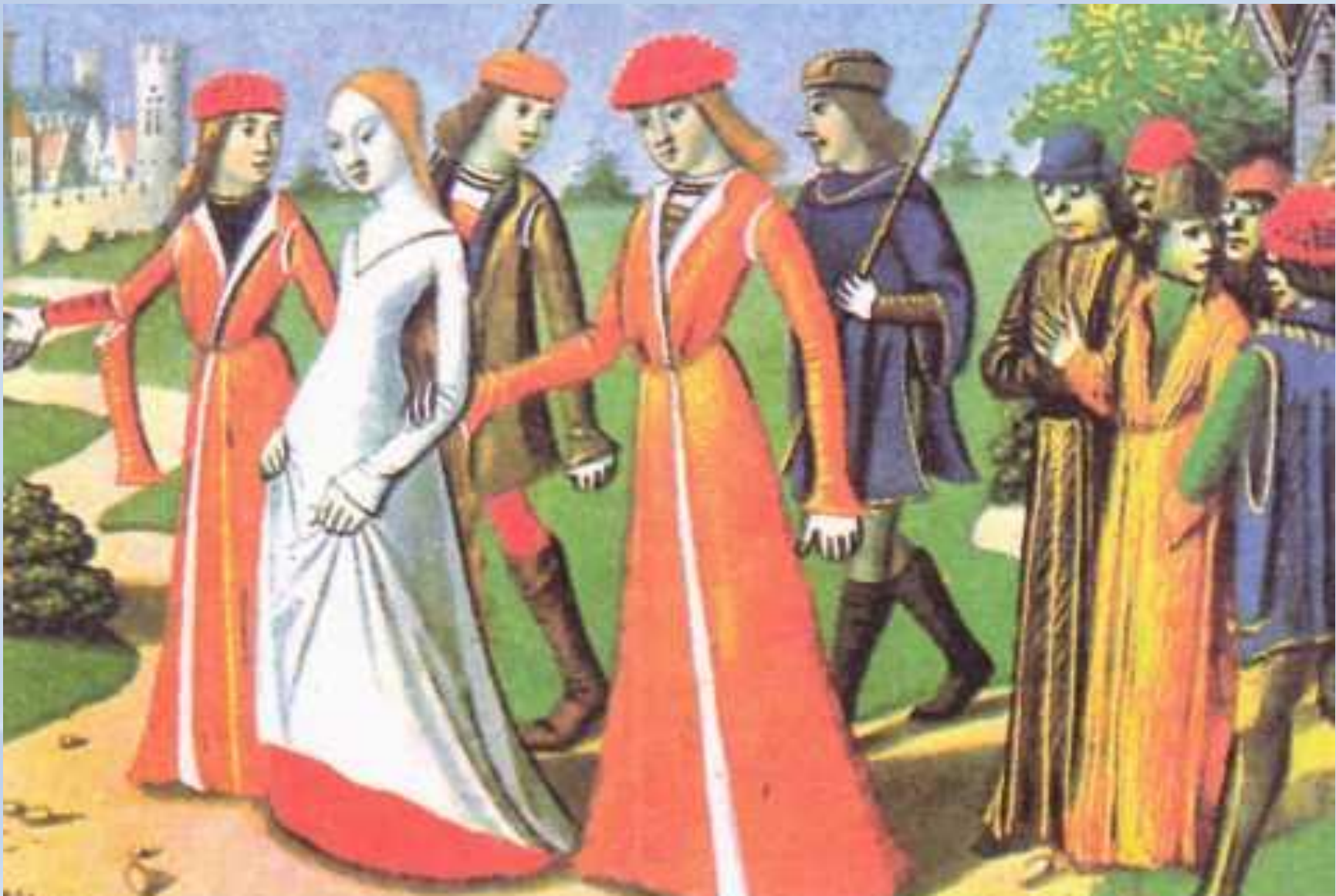
Жанна д'Арк (1412—1431) Орлеанская дева, воительница, возглавлявшая французов в войне с англичанами во время Семилетней войны