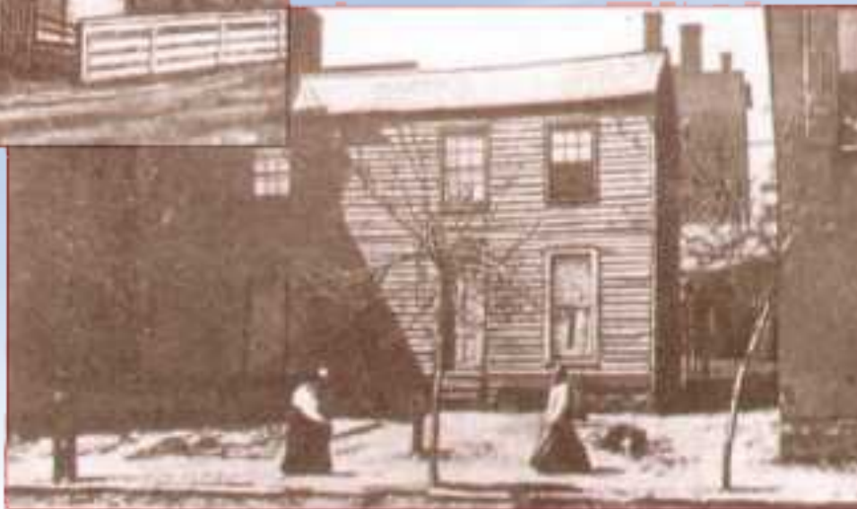
Школа в Ганнибале