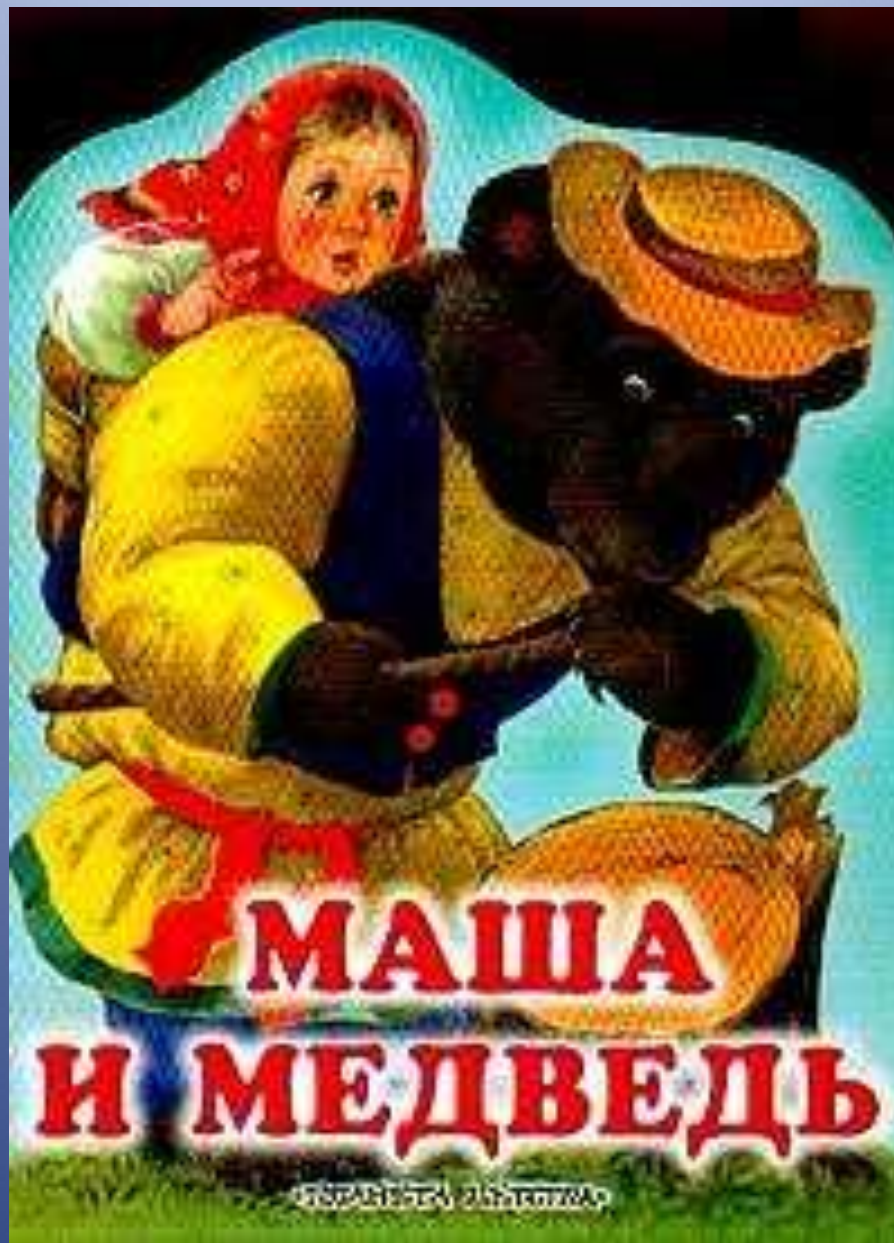
Иллюстрирование русской народной сказки 1 класс