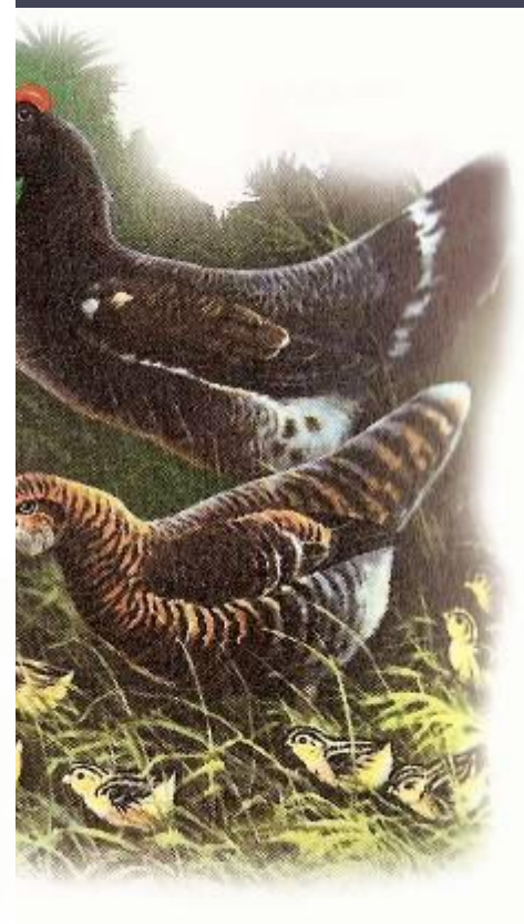
Э. Шим «Глухарь»