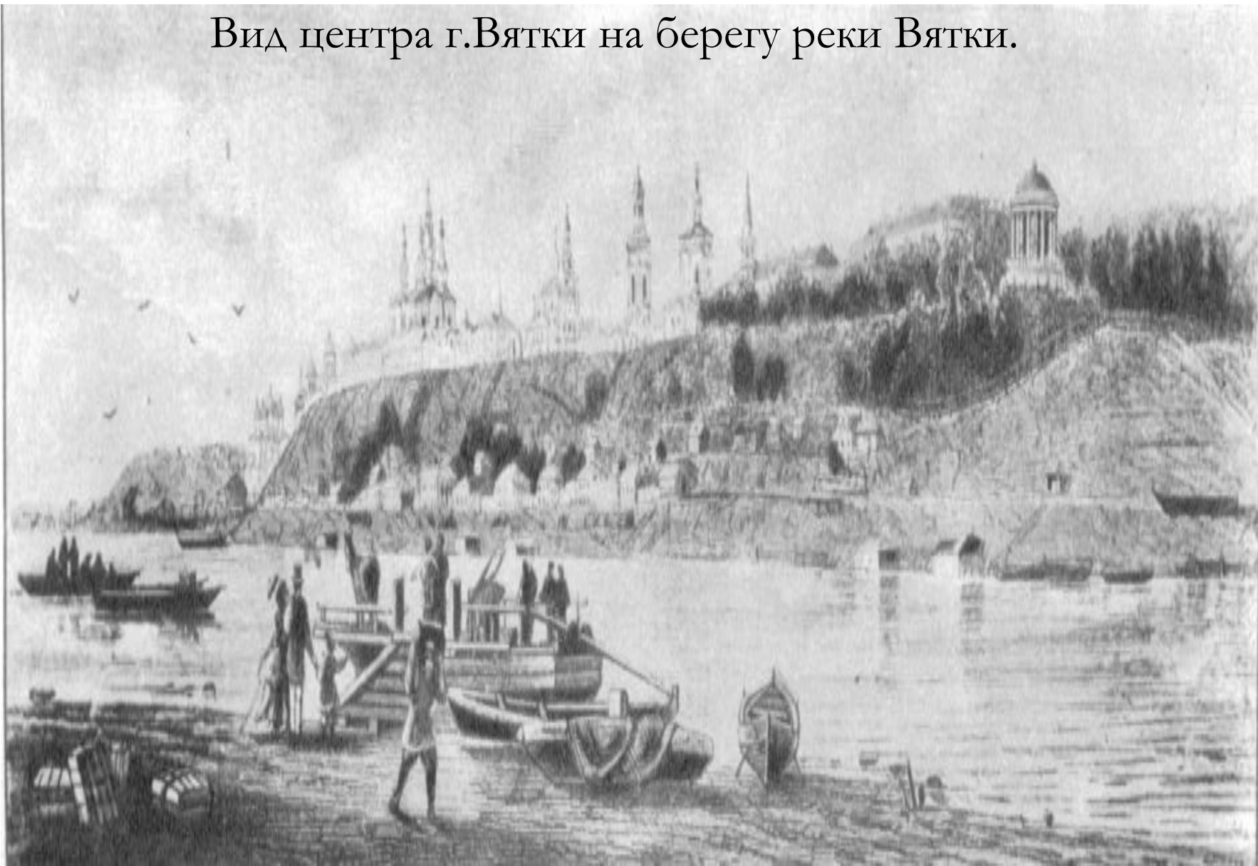
Вид центра г.Вятки на берегу реки Вятки.