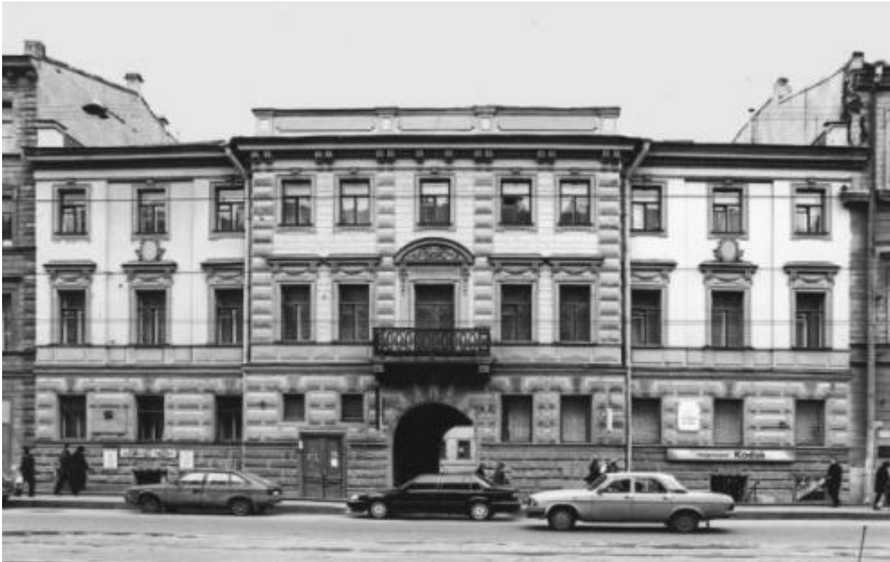
Дом, в котором жил и умер писатель М. Е. Салтыков-Щедрин в Петербурге

В феврале 1862 года Салтыков-Щедрин в первый раз вышел в отставку. Он хотел поселиться в Москве и основать там двухнедельный журнал; когда ему это не удалось, он переехал в Петербург и с начала 1863 года стал, фактически, одним из редакторов "Современника".