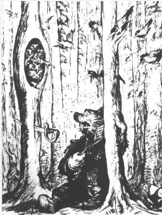
"Медведь на воєводстве"