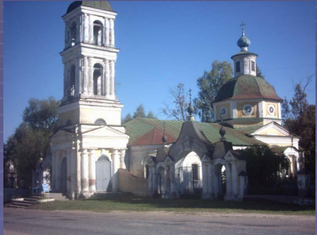
Спас-Угол - родина Салтыкова-Щедрина.