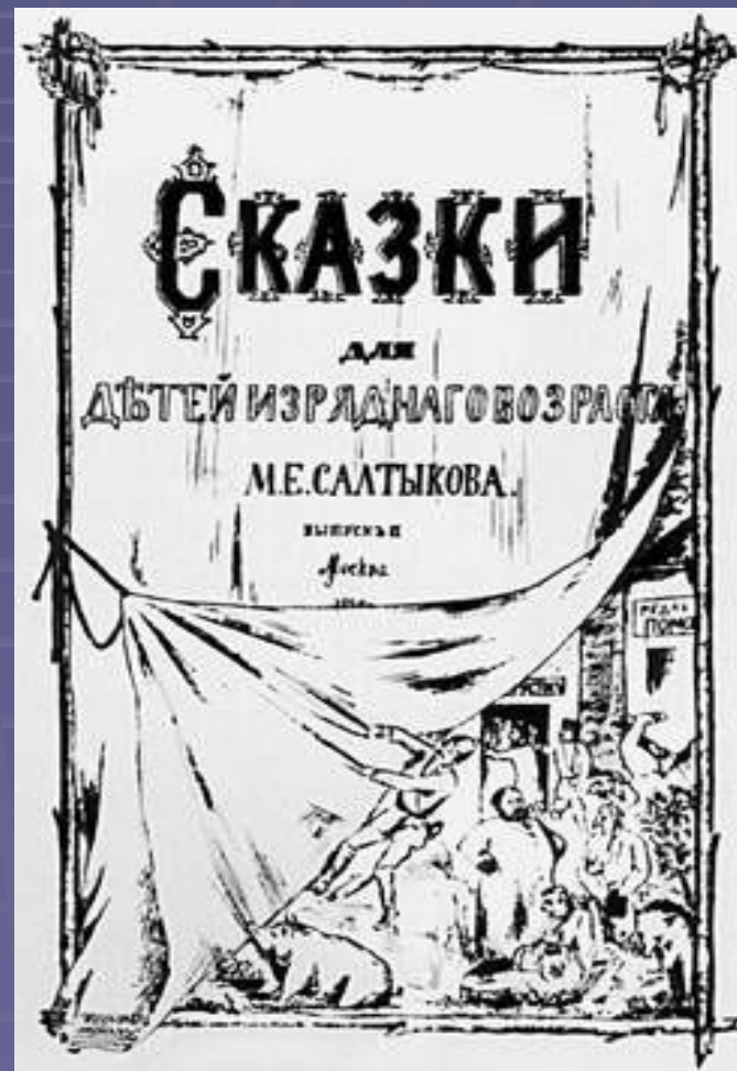
Литографированное нелегальное издание 1884.