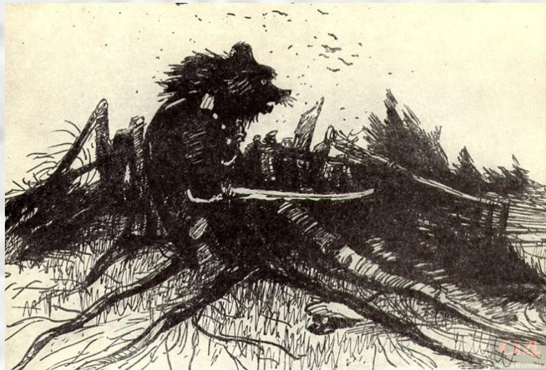
Медведь на воеводстве

Важнейшими художественными особенностями сказок М.Е. Салтыкова-Щедрина являются ирония , гипербола и гротеск . Большую роль в сказках играет также прием антитезы и философские рассуждения (например, сказка «Медведь на воеводстве» начинается с предисловия: «Злодеяния крупные и серьезные нередко именуются блестящими в качестве таковых заносятся на скрижали Истории. Злодеяния же малые и шуточные именуются срамными и не только Историю в заблуждение не водят, но и от современников не получают похвалы» ).